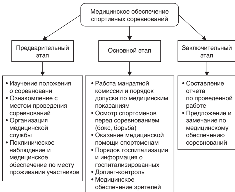
Рис. 1.4. Этапы медицинского обеспечения спортсменов, участвующих в соревнованиях