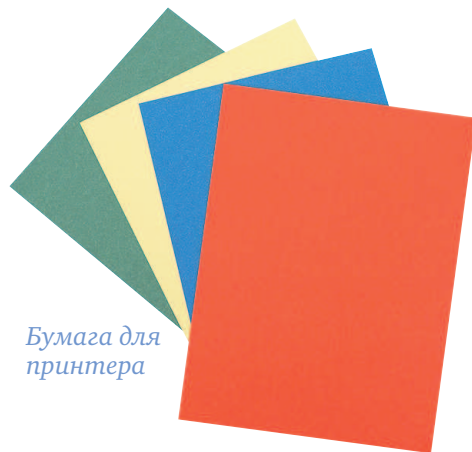
Бумага для принтера

требованиям, хотя и менее плотная (60 г/м 2 ), чем бумага для принтера. Чтобы избежать лишнего склеивания, лучше приобрести бумагу формата А4.