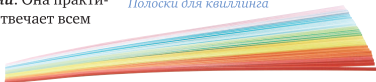
Полоски для квиллинга