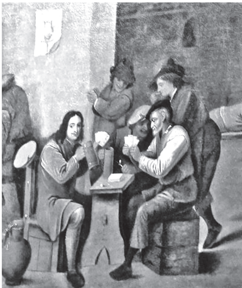
Петр I в голландском кабаке. Неизвестный художник XVIII века.