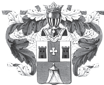
Герб рода Брусиловых