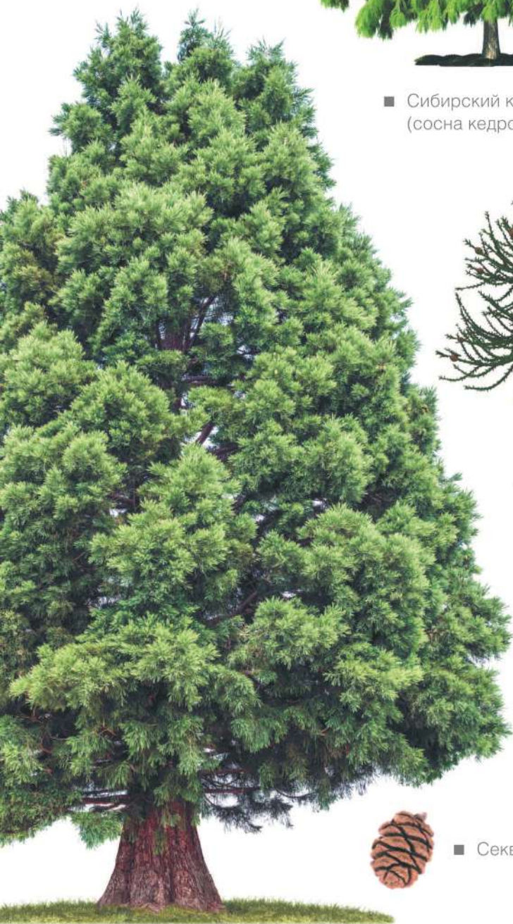
■ Секвойя вечнозеленая.