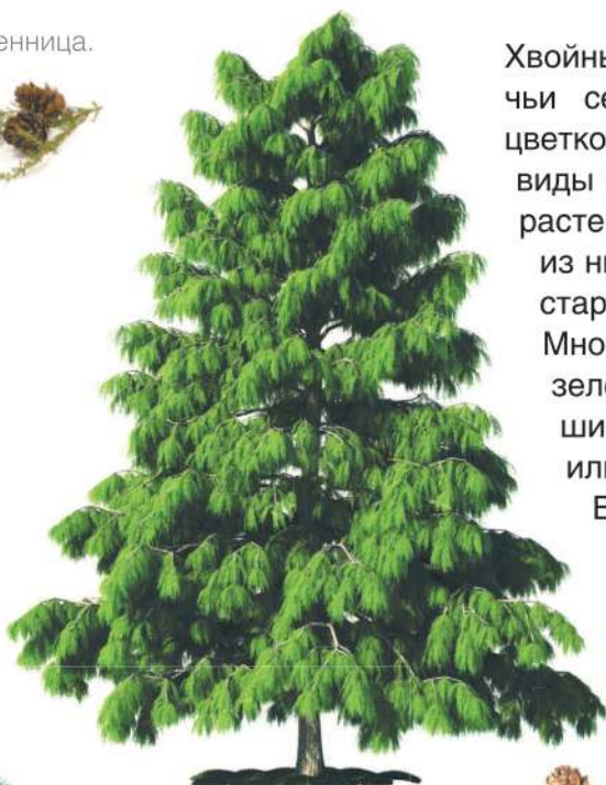
■ Сибирский кедр (сосна кедровая).

В диком виде хвойные растения растут по всему миру. Нередко их больше, чем лиственных, — например, в тайге.