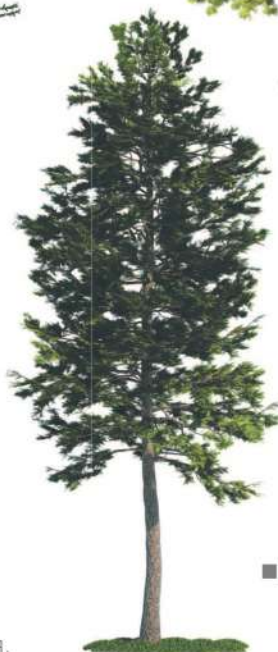
■ Сосна обыкновенная.