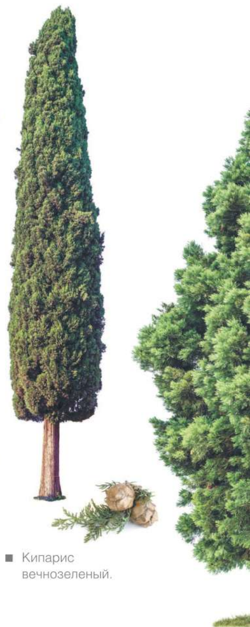
■ Кипарис вечнозеленый.