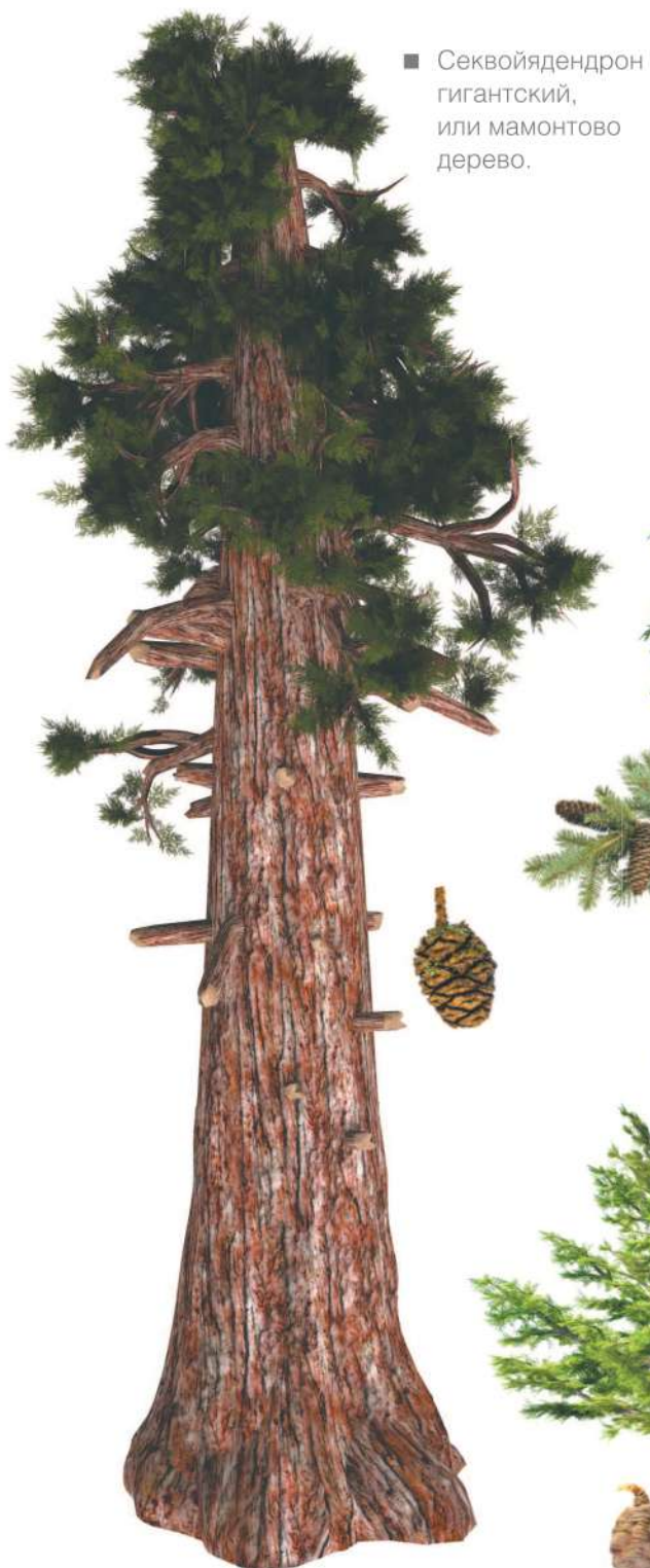
■ Секвойдендрон гигантский, или мамонтово дерево.