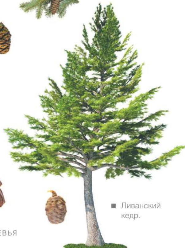
■ Ливанский кедр.