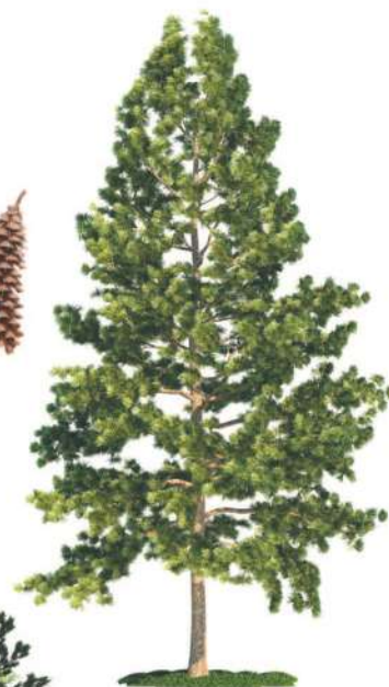
■ Белая восточная сосна.