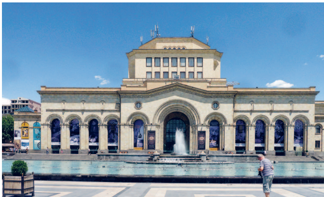
Исторический музей Армении