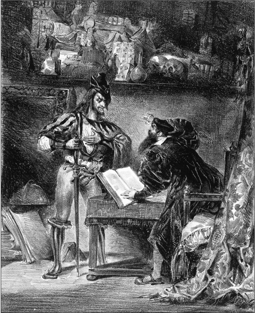
Рис. 2. Эжен Делакруа. Мefистофель предлагает свою помощь Фаусту