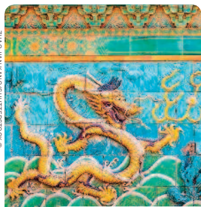
ПЕКИН С. 64