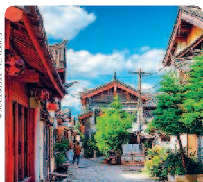
ЛИЦЗЯН С. 693