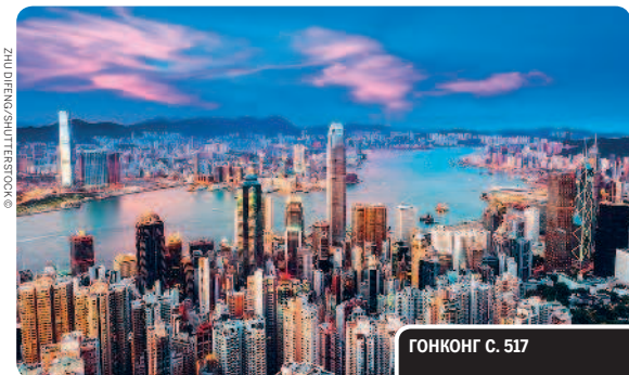
ГОНКОНГ С. 517