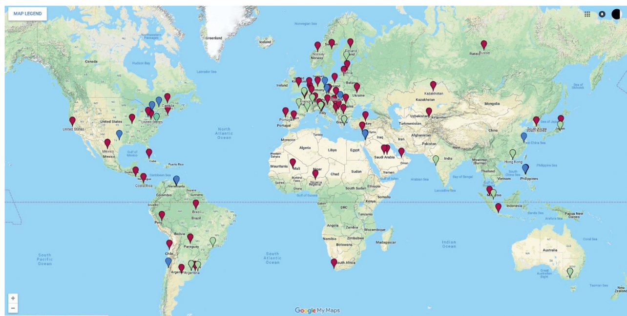
РИС. 0.1. Центры детской и подростковой гинекологии в различных странах мира (источник: http://www.figj.org/members/ ). Публикуется с согласия Международной федерации детской и подростковой гинекологии; по состоянию на 25 января 2019 г.)

Мы стремительно продвигаемся вперед и видим, как знания и опыт распространяются в рамках международного сообщества. Международная федерация детской и подростковой гинекологии создала образовательные форумы по всему миру (рис. 0.1).