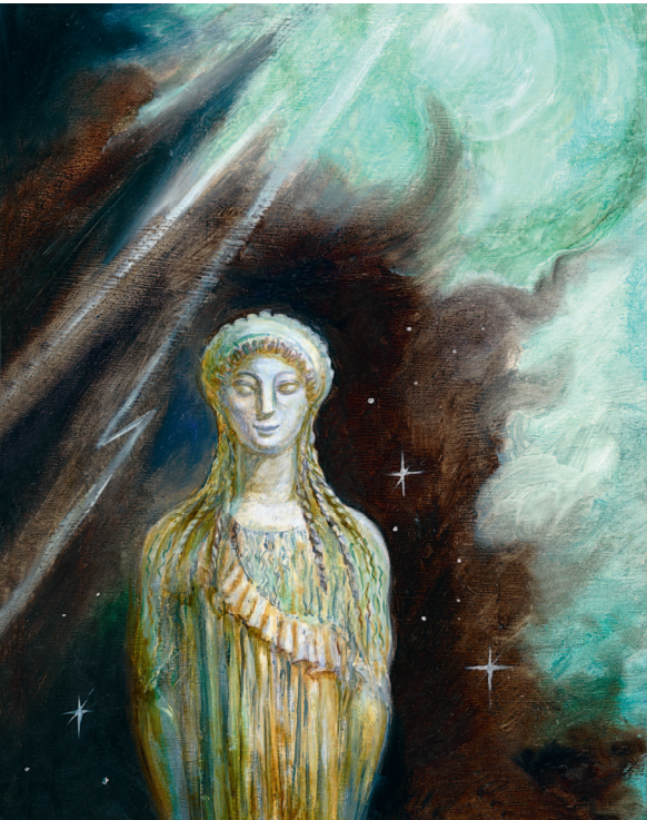
Из Хаоса возникли мир и бессмертные боги