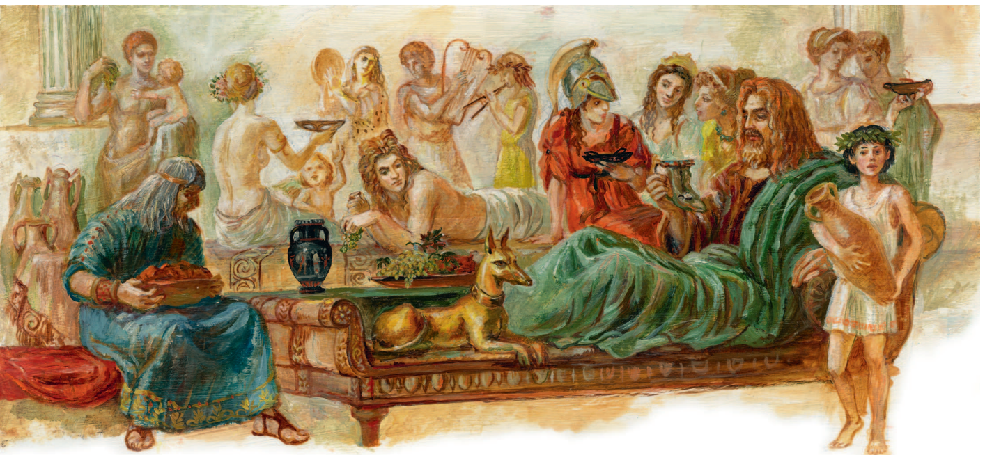
Пир на Олимпе

В пиршествах богов всегда присутствуют амброзия и нектар — пища и напиток богов. Их разносят богиня юности Геба и виночерпий Ганимед. Амброзия давала бессмертье и молодость, его создала богиня плодородия Деметра специально для олимпийских богов. Нектар — сладкий и благоухающий напиток красного цвета, также дающий бессмертье. Когда люди восклицают: «Это просто пища богов!» — имеют в виду, что пробуют блюдо или напиток прекрасного, изысканного вкуса, доступный немногим.