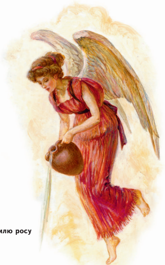
БОГИНЯ ЭОС льёт на землю росу

Великая гора Олимп — пристанище сонма богов. Над всеми царит Зевс — главный в древнегреческом пантеоне. Рядом его жена Гера, покровительница брака. Зевс утверждает порядок и законы на земле. Рядом с ними Аполлон, покровитель муз, и его сестра Артемида — богиня охоты, и золотоволосая Афродита, богиня красоты и любви, и любимая дочь Зевса — воительница Афина Паллада. Чертоги на Олимпе сделаны Гефестом, богом-кузнецом. У трона Зевса — богиня мира Эйрена и богиня победы Никэ. Здесь же богиня правосудия Фемида. Высоко над Олимпом раскинулось голубое бездонное небо, с него льётся золотой свет. Ни дождя, ни снега не бывает на Олимпе, здесь всё время благодатное лето. А ниже клубятся облака, закрывая землю.