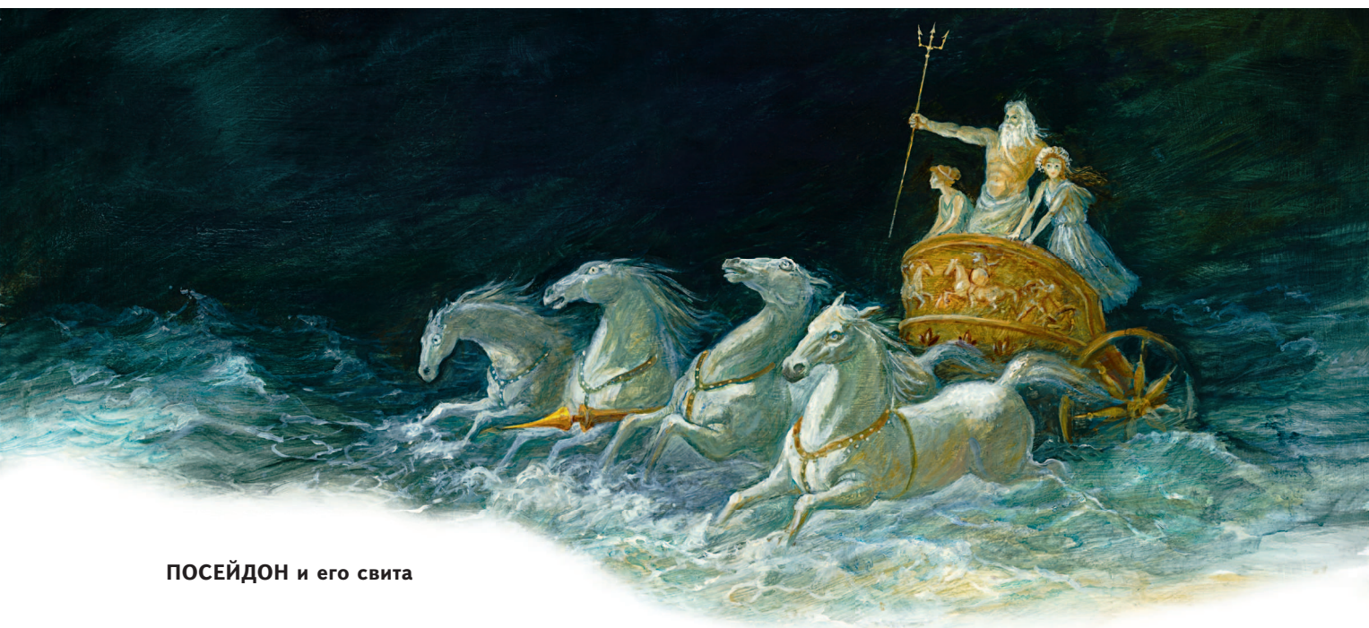
ПОСЕЙДОН и его свита

Посейдон — бог морей, у римлян — Нептун.