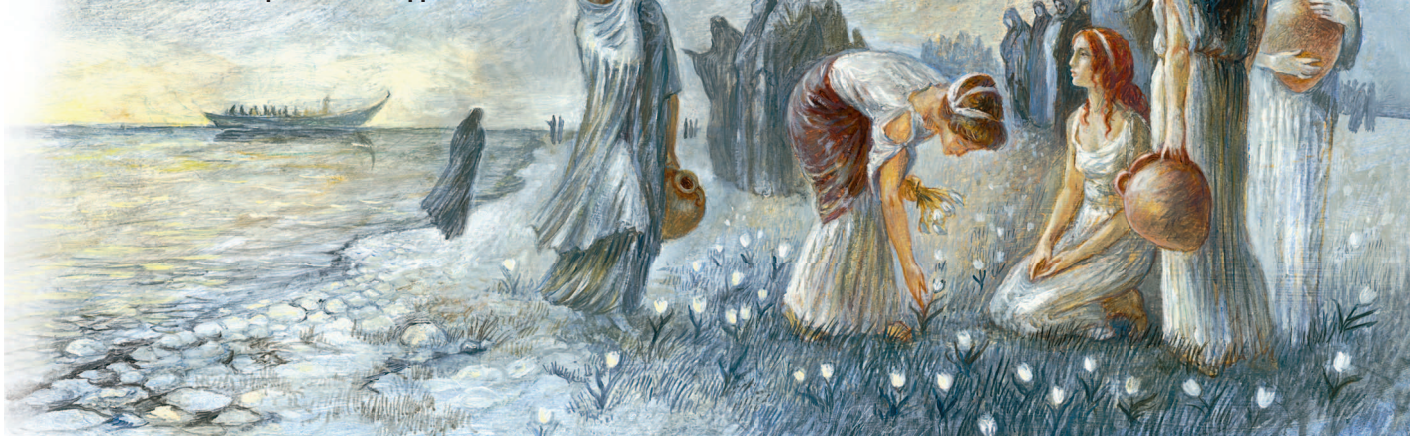
В ЦАРСТВЕ АИДА