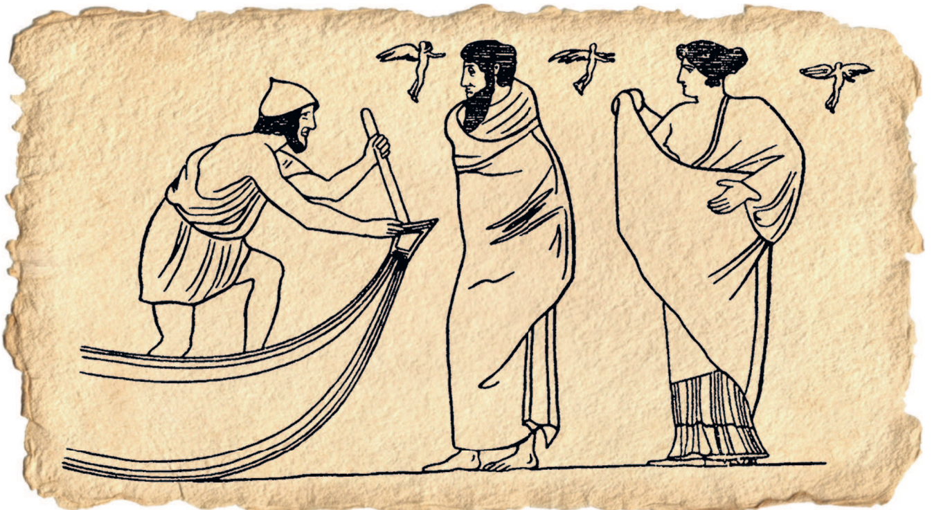
Харон перевозит души умерших

Глубоко под землёю царит Аид, брат Зевса, повелитель царства мёртвых. С поверхности земли ведут в это царство бездонные пропасти. По царству протекают подземные реки, главная из которых Стикс. По реке Ахеронт переправляет в царство Аида души умерших старец Харон. Но везёт он их только в одном направлении, и никому не удаётся вернуться обратно. У трона Аида — мрачный бог смерти Танат. Юный бог сна Гипнос вылетает из царства на землю и носится на своих крыльях с головками мака в руках — маковым молочком он смыкает веки смертных и погружает их в сладкий сон. Однако сон может стать смертельным, если Гипнос прольет молока больше, чем нужно. Здесь же боги и богини сновидений — и тяжёлых, мучительных, и лёгких, радостных или вещих, т. е. сбывающихся (по имени этого бога погружение в сон названо гипнозом). Стержёт вход в царство мёртвых ужасный пёс Кербер (Цербер). Под царством Аида находится мрачная бездна Тартар.