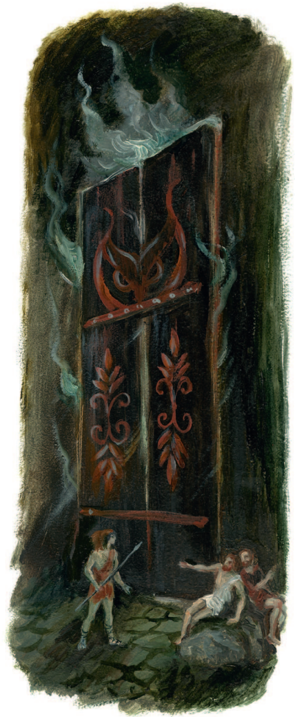
Двери в царство Аида

Великая Деметра вернула плодородие земле, и снова всё зацвело и зазеленело. Но каждый год покидает свою мать Персефона, и каждый раз Деметра погружается в печаль. И вся природа горюет по ушедшей, наступает зима. Спит природа, чтобы проснуться в радостном блеске весны тогда, когда вернётся к своей матери из безрадостного царства Аида её дочь. Тогда богиня плодородия щедрой рукой сыплет дары людям и благословляет труд земледельцев богатым урожаем.