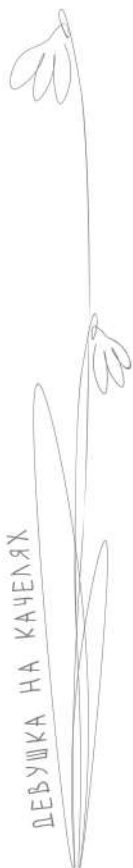
ДЕВУШКА НА КАЧЕЛЯХ

— Я не помню, как там оказалась, на дороге. Вернее, внизу, — поясняла девушка, пытаясь разобраться в своей ситуации.