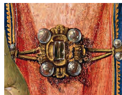
Росселли Козимо. Мадонна с младенцем и ангелами . 1480–1482. Темпера и золото на дереве. Музей Метрополитен, Нью-Йорк

Аграф (от старофр. agrafe – зажим, крючок) – брошь-застежка для одежды, мантий или причесок. История аграфа началась в XIII веке. Нарядные аграфы оказались настолько популярны среди европейской средневековой знати, что за сравнительно короткий срок практически вытеснили из употребления древнюю фибулу. Различие между аграфом и фибулой в том, что аграф представляет собой застежку,