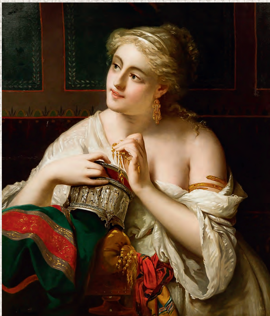
Пьер Оливер Джозеф Куманс. Шкатулка с драгоценностями. 1889. Холст, масло. Частное собрание