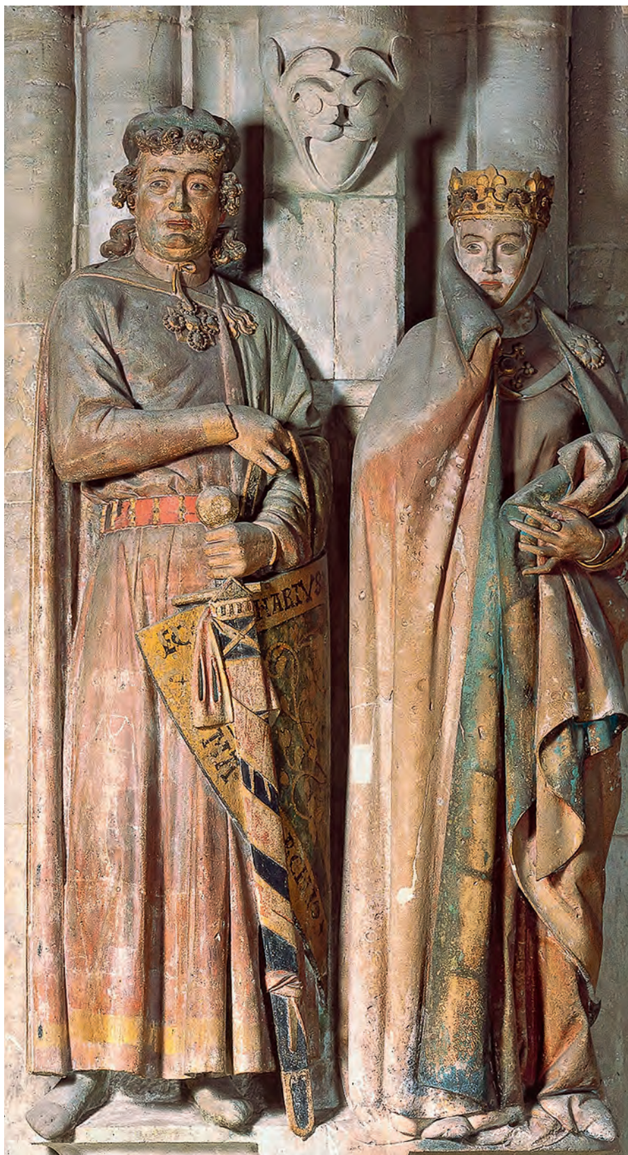
Маркграф Экхарт II и маркграфиня Ута Балленштедтская. Скульптурная группа. Середина XIII века. Наумбургский собор, Наумбург Плащи на маркграфе и маркграфине скреплены аграфами.