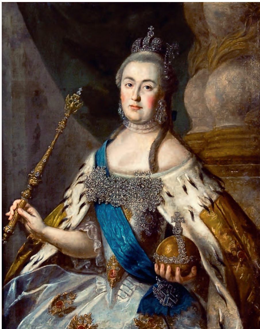
Алексей Антропов. Портрет императрицы Екатерины II. 1766. Холст, масло. Волгоградский музей изобразительных искусств имени И. И. Машкова, Волгоград