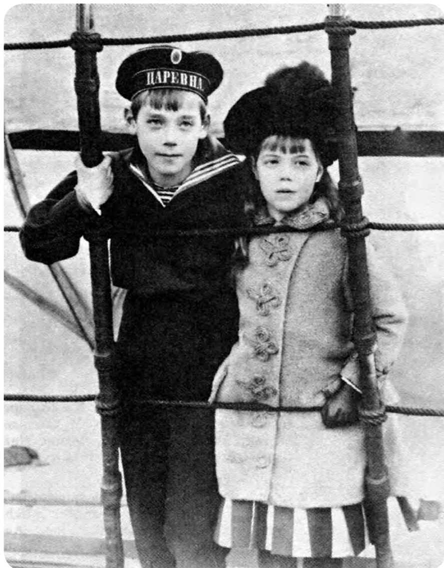
Великий князь Михаил Александрович и великая княжна Ольга Александровна у леерного ограждения императорской яхты «Царевна»