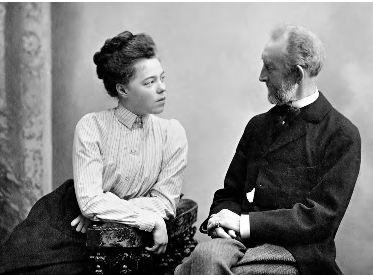
Великая княжна Ольга Александровна с Хансом Глюксбургским, братом короля Дании Кристиана IX