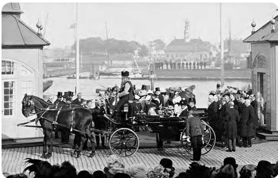
Приезд императрицы Марии Федоровны в Тольдбоден (таможня)