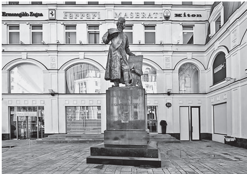
Памятник первопечатнику Ивану Фёдорову в Театральном проезде. Современная фотография

ные миграционные процессы, следствием чего было, в частности, образование смешанных браков и смешанного булгаро-славянского населения. Из их числа с большой долей вероятности был Стефан (Степан) Иванович Кучка 21 . Лавры основателя Москвы наряду с Юрием Долгоруким по праву может разделить и строптивый хозяин Кучковых сел, который, проявив непочтение к князю, пал от рук воинов Юрия Долгорукого. Не случайно, что у древней Москвы долгое время было второе название — Кучково 22 . О двойном названии Москвы — «Москва, рекше Кучково», то есть «Москва значит Кучково», свидетельствует богатая русская летописная традиция 23 . Несговорчивому Степану Ивановичу обязаны своим (во всяком случае, фамильным) происхождением его многочисленные потомки — Кучкины, Кучковы, Кучковичи и т. д.