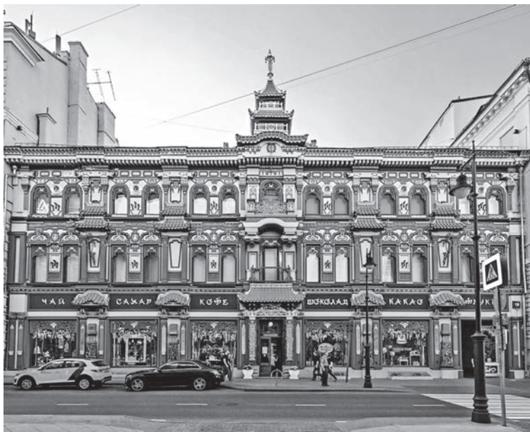
«Чайный дом» (Мясницкая ул., 19). Современная фотография

азиатских государств — таджиков, киргизов, узбеков и казахов, а также турок, арабов, персов, афганцев и боснийцев. Как и любой европейский мегаполис, современная Москва представляет достаточно пестрое в этнокультурном плане образование с очень заметной составляющей азиатско-мусульманских народов, насчитывающих, по разным источникам, от 1,5 до 3 млн человек. Оглядевшись вокруг, легко заметить, что мусульманский Восток, как это было также очевидно в период динамичного развития связей Руси с Золотой Ордой (XIV–XV вв.), стал сегодня неотъемлемой частью столичной действительности и нашего каждодневного бытия. Московские дворы, которые приводятся в порядок и содержатся в чистоте выходцами из бывших среднеазиатских республик, или московские мечети, пространство вокруг которых в дни исламских религиозных праздников заполняется мусульманской молодежью, — это новые, доселе неизвестные реалии московского быта XXI в. Магазины татарской кулинарии «Бахетле», сеть ресторанов узбекской и азербайджанской кухни «Чайхона № 1»,