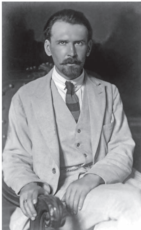
Н. С. Трубецкой (1890–1938) — один из основоположников евразийства

Уже в средневековой Москве наблюдается самое настоящее разнообразие культур и религий. В Москве можно было встретить послов, представлявших «Чагатайский улус и Ливонский орден, Южную Грузию и северную Каянскую землю, Ватикан и Венецианскую республику, Датское королевство и ганзейские города, императора Священной Римской империи и турецкого султана» 3 . Известный французский литератор и путешественник маркиз А. де Кюстин (1790–1857) полагал, что «гостеприимные обычаи древней Азии и изящные манеры цивилизованной Европы назначили