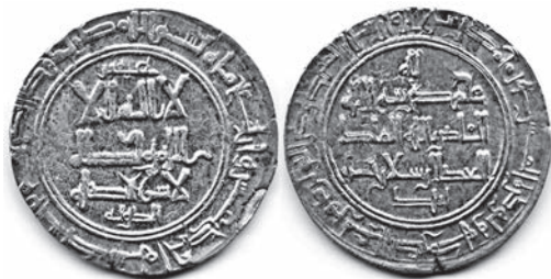
Арабский куфический дирхем VIII–X вв., встречается на территории Европейской России

Таким образом, можно признать, что история заселения территории, на которой возникла современная Москва — это история смешения разных по времени и по происхождению этнокультурных миграционных потоков, в том числе идущих из центров, имеющих цивилизационную связь с арабо-мусульманским Востоком. По мнению академика В. В. Бартольда, периодом наиболее тесной культурной связи с Востоком был для России самый ранний, дохристианский период* ее истории. В то время бассейн Волги находился под непосредственным влиянием переднеазиатских культурных элементов. Например, в городе Саксине** были известны колонии среднеазиатских и иранских купцов. «Россия вела оживленную торговлю с Багдадским халифатом (в то время — самое культурное государство в мире) и халифские серебряные монеты в большом количестве оставались в Восточной Европе» 11 . Современная археология также дает убедительное свидетельство того, что экономический подъем Волго-Окского междуречья в конце XII — начале XIII в. обеспечивался в значительной мере за счет активных торговых связей с мусульманским Востоком. Импорт предметов исламской художественной промышленности — стекла, ткани, керамики, домашней посуды, ювелирных изделий во многом формировал хозяйственную жизнь этого региона и определил синкретический характер культуры социальной элиты Москвы того времени 12 .