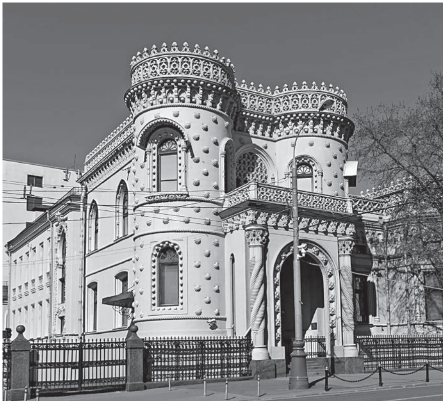
Особняк Арсения Морозова, ныне Дом приемов Правительства РФ (ул. Воздвиженка, д. 16). Современная фотография

преданию, эта земля была подарена митрополиту Московскому Алексию, который в 1357 г. ездил в Орду по приглашению хана Джанибека для исцеления от слепоты ордынской царицы Тайдулы 11 .