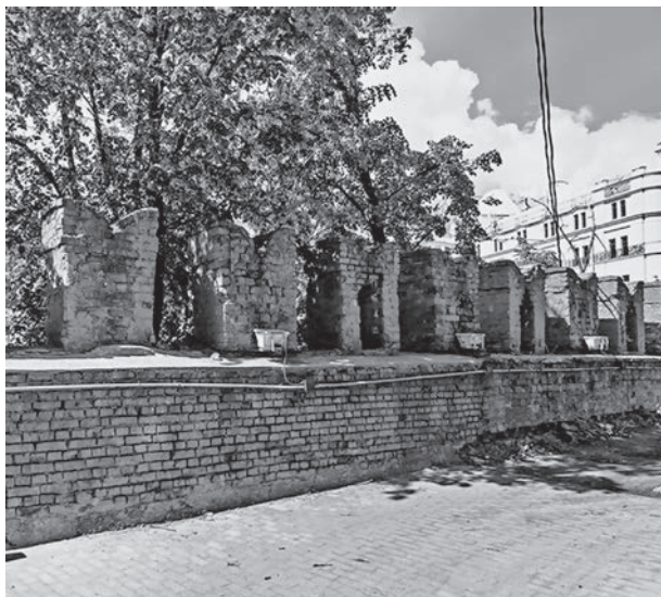
Фрагмент сохранившейся части Китайгородской стены на площади Революции у Николо-Греческого монастыря. Современная фотография

Факт выбора Юрия Долгорукого основателем Москвы можно объяснить по-разному, но скорее всего тем, что окончательная «редакция» исторических событий происходила значительно позже, когда после взятия турками в 1453 г. Константинополя окончательно восторжествовала мессианская идея «Москва — Третий Рим» и история Русского государства писалась под прямыми наследников антично-византийской традиции — великих князей, начиная от отца Юрия Долгорукого Владимира Мономаха (1053–1125). Худородный, но гордый Кучка, чья дочь Улита, мстя за отца, убила своего мужа князя Владимиро-Суздальского Андрея Боголюбского (1111–1174), для почетной роли основателя Москвы и Московского княжества по понятным причинам никак подходить не мог. По версии Тверского сборника — летописного свода середины XVI в., именно на «болгарыню» Улиту, возненавидевшую своего супруга за походы на волжских болгар, возложена вина за смерть князя Андрея 24 . Существенным дополнением к этому историческому сюжету является то, что тюрк-