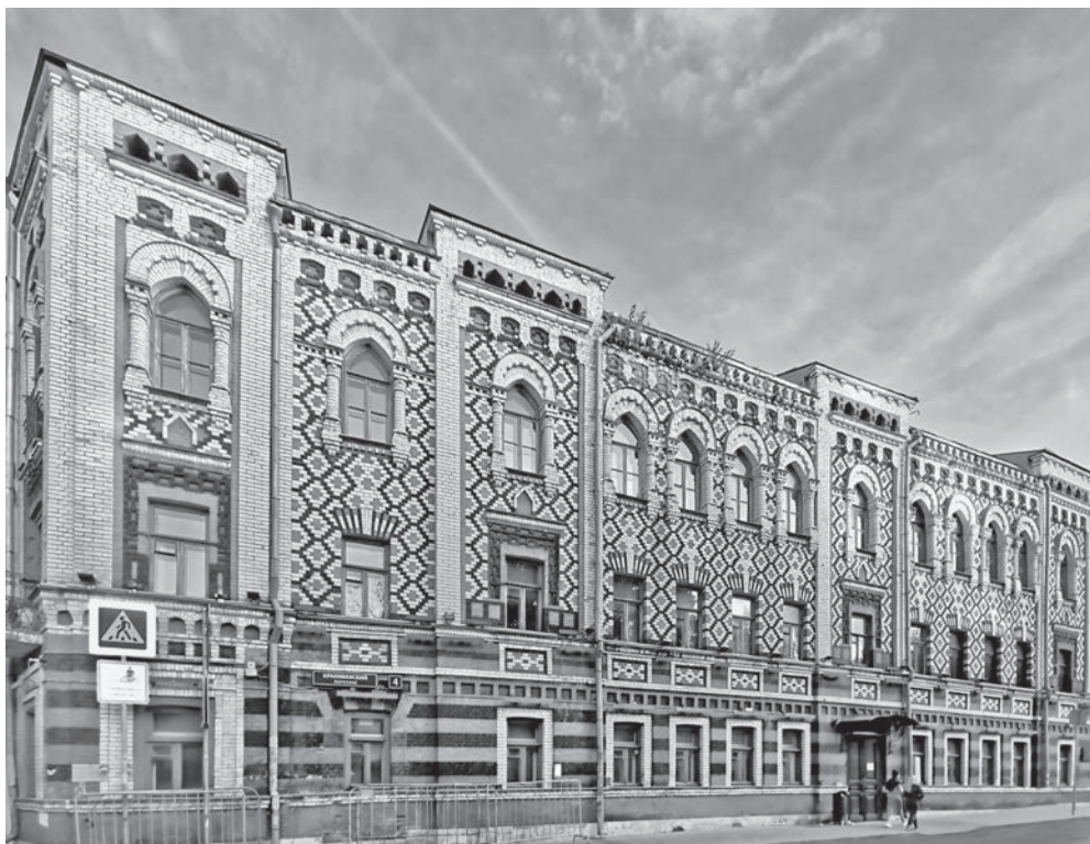
Константинопольское подворье (Крапивенский пер., д. 4).