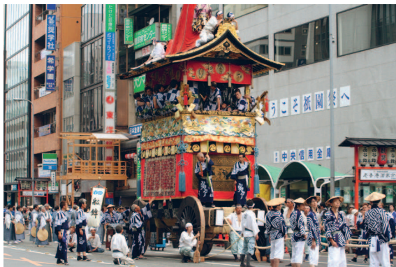
Платформа во время парада гигантских паланкинов Гион Мацури в Киото, одного из многочисленных японских фестивалей, 2009.

Я был слишком робким, и моя мать была такой же. Когда я навещал ее в больнице, не мог заставить себя сразу подойти к ней и поцеловать». В мультфильме мать Сацуки показывает привязанность к дочке, глядя ее по волосам, но Миядзакэ с матерью так и не нашли способа выразить свои взаимные чувства. Несмотря на то что режиссер отказывается считать «Моего соседа Тоторо» исключительно ностальгическим произведением, мультфильм во многом вдохновлен его собственными детскими переживаниями о болезни матери. Раннее взросление Сацуки, ее забота о младшей сестре и помощь по хозяйству взяты из личного опыта Миядзакэ 1 . Он вспоминает: «Когда мать лежала в больнице, а я возвращался из школы в пустой дом, я испытывал настоящее одиночество... [Сацуки] пришлось стать более взрослой и сильной, как это свойственно детям в таких ситуациях. <...> Десятилетний ребенок может управиться с работой по дому. Я убирался, топил баню и готовил».