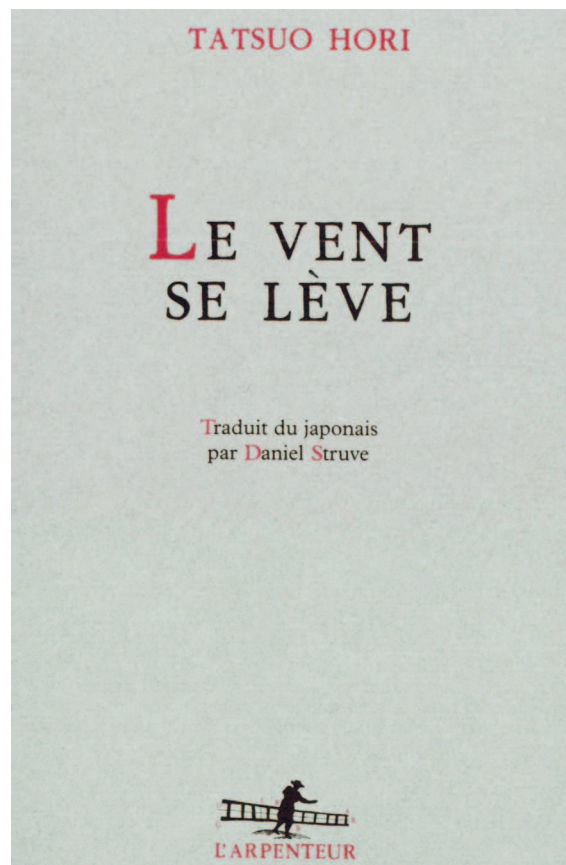
Обложка французского перевода романа Тацуо Хори «Ветер крепчает».