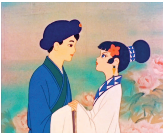
Кадр из мультфильма «Легенда о Белой Змее», 1958 год.

«В пору детства я был, как говорится, хорошим мальчиком. Я не делал то, что хотел, потому что пытался соответствовать ожиданиям родителей. <...> Когда я впервые увидел «Легенду о Белой Змее» 1 , у меня как будто открылись глаза; я понял, что хочу <...> рисовать мангу, которая говорила бы детям: “Дети, не дайте родителям задушить вас в объятиях” или “Перестаньте зависеть от своих родителей”» 2 . В этой речи, произнесенной в июне 1982 года в университете Васэда в Токио, Миядзаки объясняет, что в начале творчества ему было важно поощрять детей расти самостоятельно, не обращая внимания на обязательства и ожидания родителей.