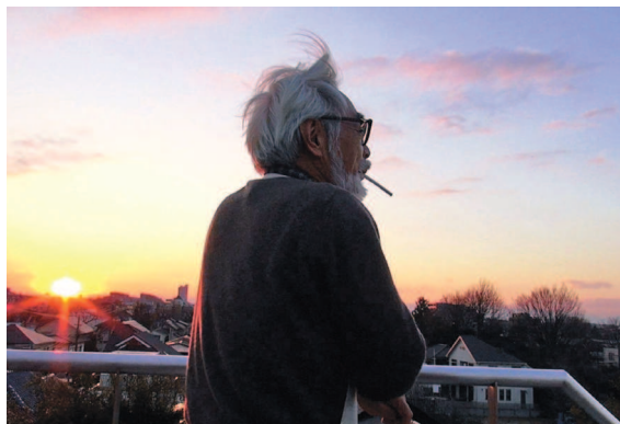
Бесконечный человек: Хаяо Миядзаки. © NHK

«Конан — мальчик из будущего» ( Mirai shônen Conan , см. стр.122) Аниме-сериал, Nippon Animation Художник-мультипликатор, художник-постановщик