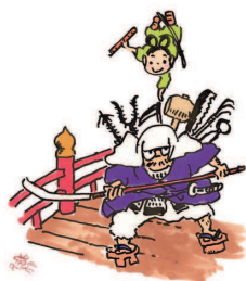
Рисунок Хаяо Миядзаки к спектаклю «Навиская из долины ветров».

Дебютировав в японской студии Toei Animation, Миядзаки прошел всю цепочку производства манги и анимации. Благодаря своему невероятному трудолюбию аниматор получил богатейший опыт, который лег в основу его творчества, опирающегося на японские и европейские мифы и обращенного к людям всех возрастов и национальностей. Своим примером он показал тысячам начинающих мультипликаторов, что можно творить, не стесняясь своих амбиций.