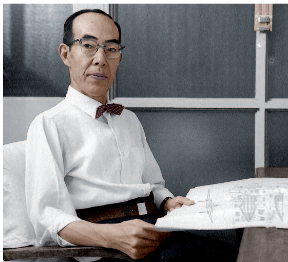
Дзиро Хорикоси (портрет).

Несмотря на то что Хаяо Миядзакэ тщательно скрывает личную жизнь от посторонних глаз, она так или иначе проскальзывает во многих его произведениях. Наиболее явно она проявляется в од-