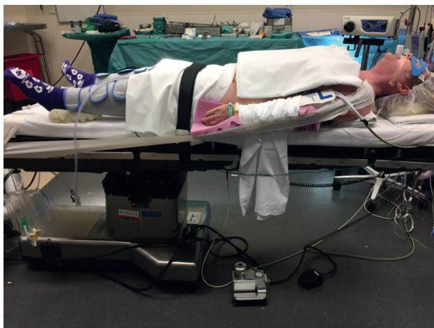
Рис. 1.3. | Правильное положение пациента для передней шейной дискэктомии и спондилодеза