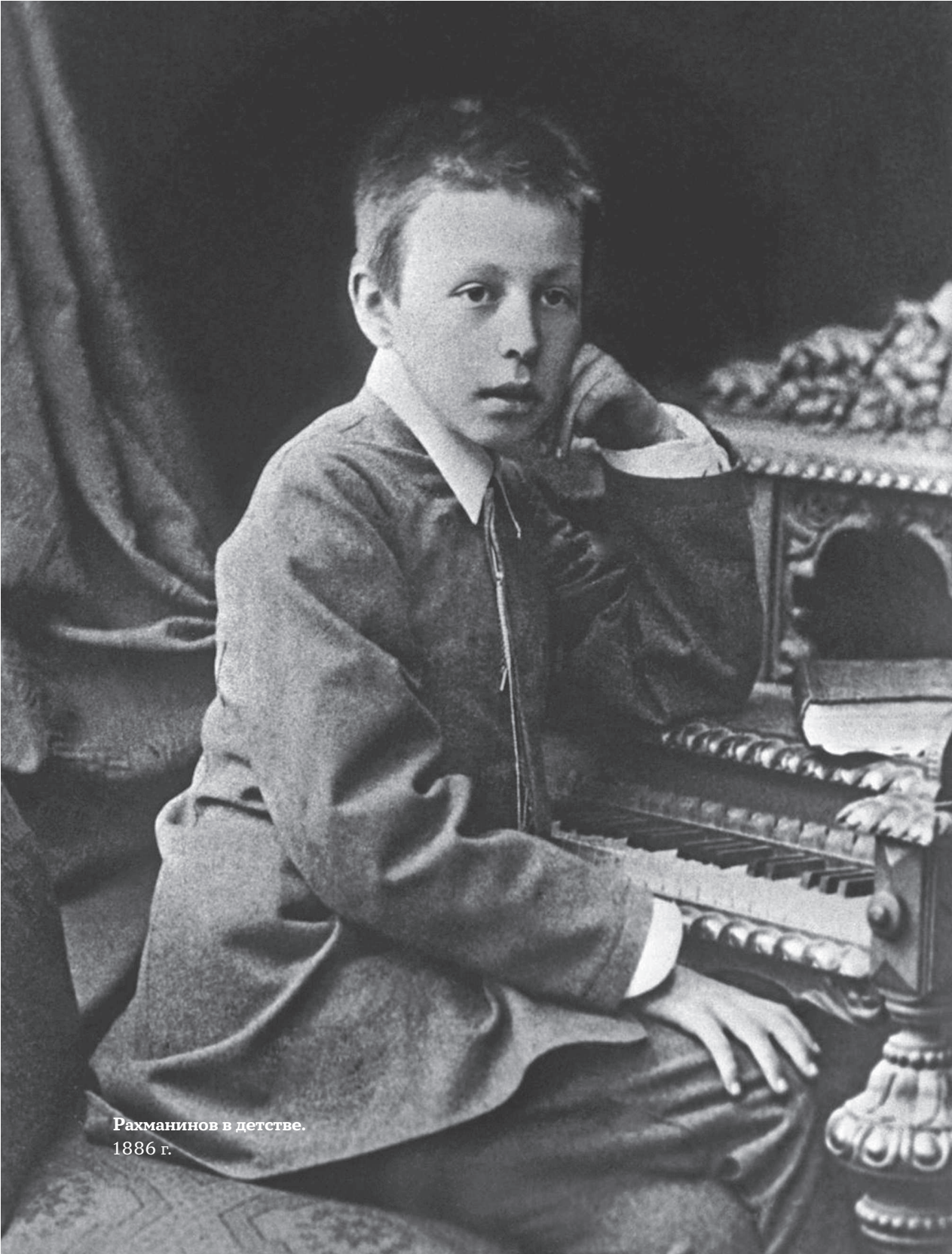
Рахманинов в детстве. 1886 г.