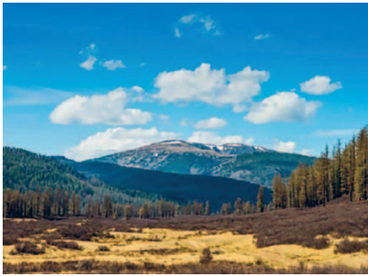
Священная гора Бурхан Халдун. Монголия.

Дальнейшее изложение монгольским летописцем родословной прародителей Чингисхана (VIII—XII вв.), в частности, истории Алан гоо и ее семьи (вторая половина XV в.), прежде всего, проливает свет на хозяйственную и общественную организацию древнемонгольского общества в интересующую нас эпоху: «Отец Алан гоо — хорь тумэдский ноён 1 Хорилардай мэргэн, а мать — Баргужин гоо; родилась Алан гоо в уделе хорь тумэдов в местности, называемой Ариг ус... Хорилардай мэргэн отошел от пределов хорь тумэдских по причине раздоров, вспыхнувших меж близживущих родов, кои желали отвоевать друг у друга уделы, обильные зверем — соболем и белкой. Хорилардай мэргэн и люди его обособились, и прозвались они племенем Хорилар по имени ноёна своего. Прознав, что в окрестностях Бурхан халдуна зверя в изобилии, хорилары перекочевали в удел Шинчи баяна урианхайского 2 , который поставил на горе Бурхан халдун кумира для поклонения духам-хранителям той горы 3 » 4 .