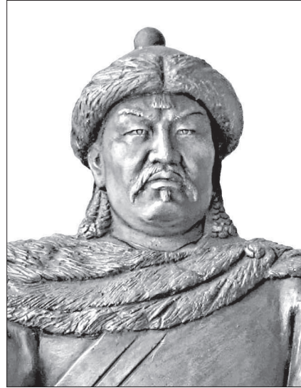
Хабул-хан (ориентировочно род. 1101, умер в 1148 г.) — предводитель родоплеменного объединения «Хамаг Монгол улс» (Улус Все Монголы), традиционного номадистского протогосударства, существовавшего в 30–80-ые годы XII века; прадед Чингисхана.