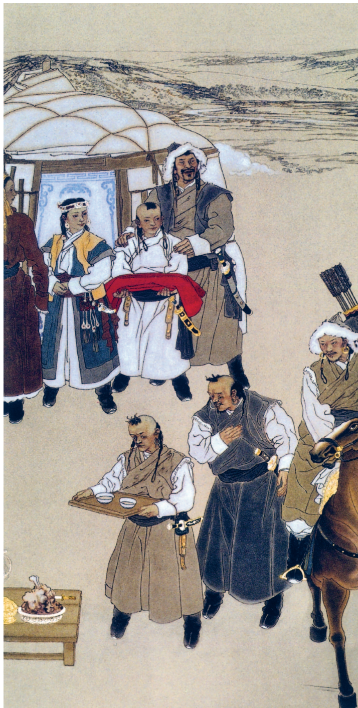
Есухэй-батор сосватал сыну Тэмужину невесту Бортэ. Современная настенная живопись. Мемориал Чингисхана в Ордосе (КНР).