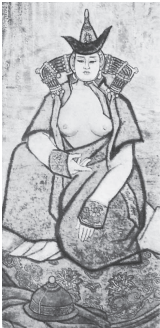
Огэлун — мать Тэмужина — Чингисхана.

В конце концов, царство утвердилось за ним (Он-ханом. — А. М.) 1 .