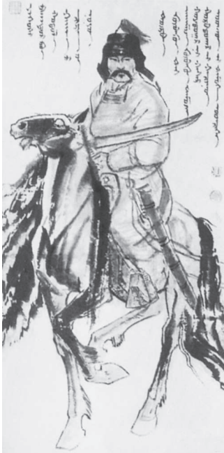
Есухэй-батор — отец Тэмужина — Чингисхана.