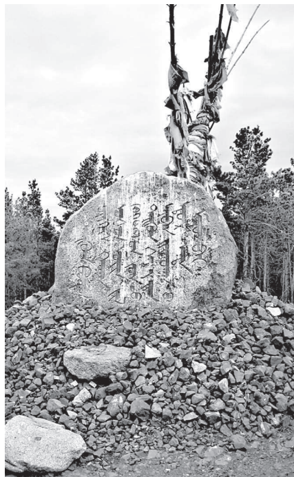
Памятный камень, установленный в долине Дэлун болдог (Хэнтэйский аймак, Монголия) на предполагаемом месте рождения Тэмужина-Чингисхана.

По мнению монгольского ученого Ч. Далая, Чингисхан намекает на свое необыкновенное рождение «в околплодном пузыре». Это край-