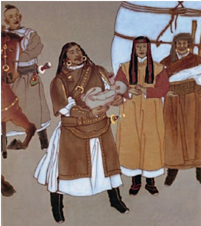
Есүхэй-батор и Огэлун с новорожденным Тэмужином. Современная настенная живопись. Мемориал Чингисхана в Ордосе (КНР)