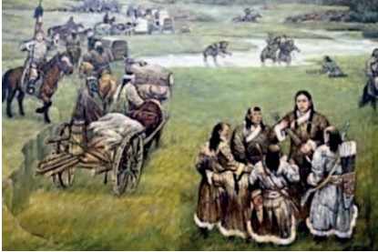
Огэлун, мать Тэмужина-Чингисхана, беседует с детьми. Современная панорама. Государственный музей города Хух-хот (КНР)

«Второй сын был Жочи хасар. Жочи — имя, а значение (слова) хасар — хищный зверь. Так как он был (человеком) весьма сильным и стремительным, то стал обозначаться этим эпитетом.