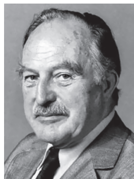
Alan Lyell (1917–2007). Шотландский дерматолог