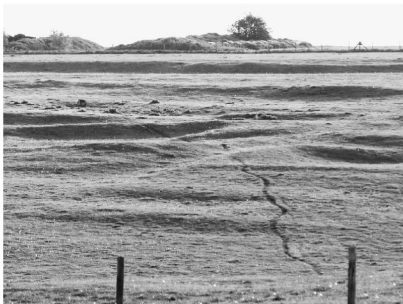
Холмики и кочки, сохранившиеся на военном стрельбище, выдают местоположение крупной зажиточной бриттской деревни времен римского владычества

гом в проулках, родители бранили их — и одновременно настраивали ткацкие станки, стригли овец, створаживали молоко, подковывали скотину, вялили мясо на зиму. Утки крикали, свиньи хрюкали, волю мычали и фыркали, свежие кучи навоза испускали пар. Оставаясь у домашнего очага — центра жизни, — женщины все видели и обо всем знали. Фруктовые деревья цвели весной и приносили яблоки, сливы или мушмулу осенью, огороды, удобренные свиным, овечьим и козьим навозом, давали бобы, капусту, чечевицу, морковь, травы и репчатый лук (последнее — кулинарный вклад римлян). На полях попеременно выращивали то пшеницу или ячмень, то лен с нежно-голубыми цветами, который шел на изготовление льняной пряжи и льняного масла. Овцы паслись на окрестных холмах. Вес-