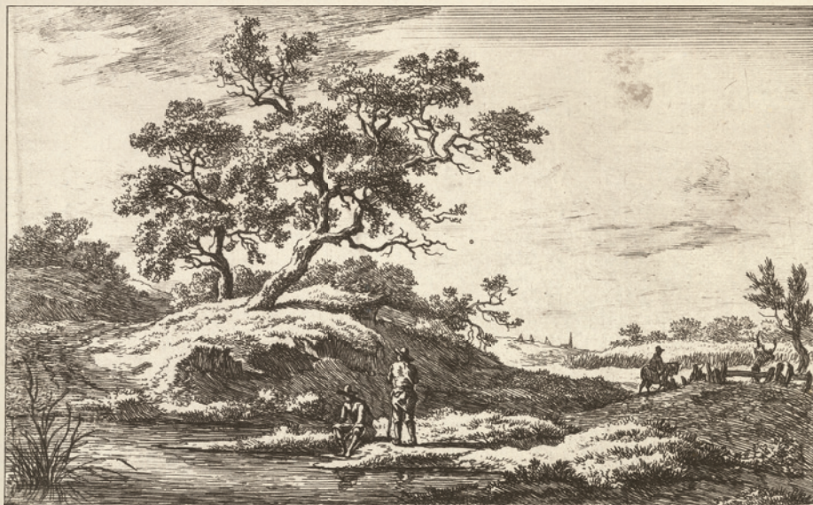
✿ Карел Лодевейк Хансен. Путешественники на набережной в Дренте. Офорт. Ок. 1780–1840. Рейксмюсеум, Амстердам