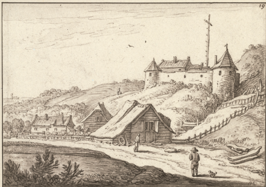
✿ Герман Сафтлевен. Пейзаж с замком (Холм в Гронингене?). Рисунок. 1619–1685. Рейксмюсеум, Амстердам