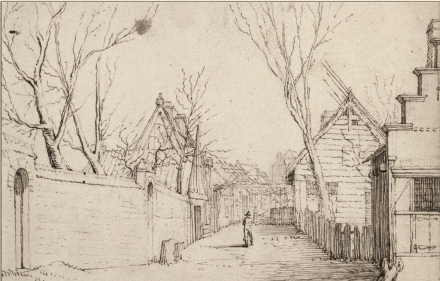
✿ Герард тер Борх Мл. Мужчина на улице в городе Зволле, столице Оверэйссела. Рисунок. Ок. 1631–1633. Рейксмюсеум, Амстердам