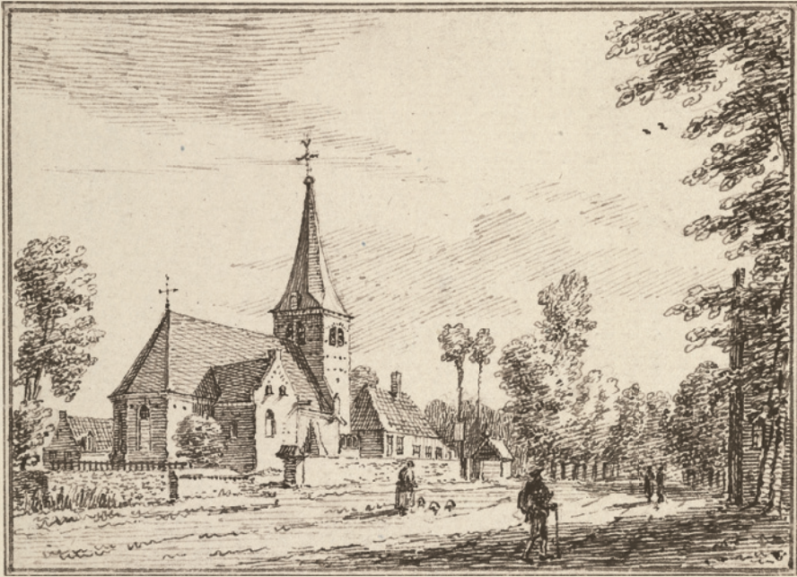
✿ Хендрик Стилман. Деревня на реке Велюве. Рисунок с работы Абрахама де Хазна Мл. Рисунок. 1737–1784. Рейксмюсеум, Амстердам