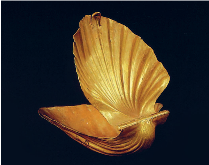
Пудреница в виде золотой ракушки. Обрядовый дар в гробницу Сехемхета. Египетский музей, Каир