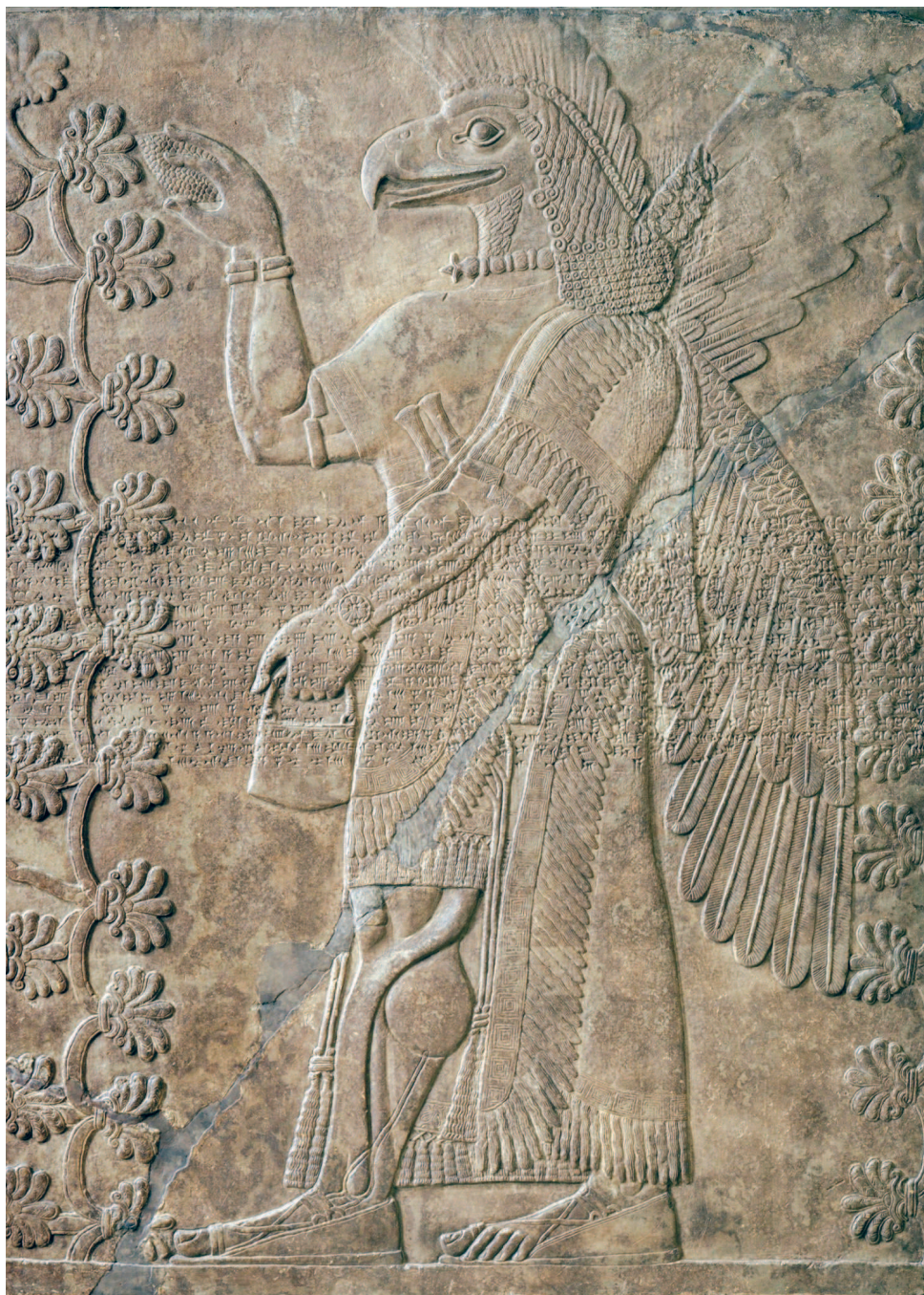
Божество с головой орла из Нимруда. Неоассирийский период, IX век до н. э. Музей искусств округа Лос-Анджелес