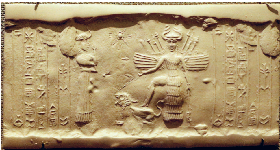
Печать Инанны. Аккадская цилиндрическая печать, изображающая богиню Инанну, положившую ногу на спину льва, в то время как ее визирь Ниншубура стоит перед ней, выражая почтение, около 2334–2154 годов до н. э. Институт Востока Чикагского университета

применяли экскременты животных: издаваемая ими вонь вынуждала злых духов покинуть тело больного» 1 .