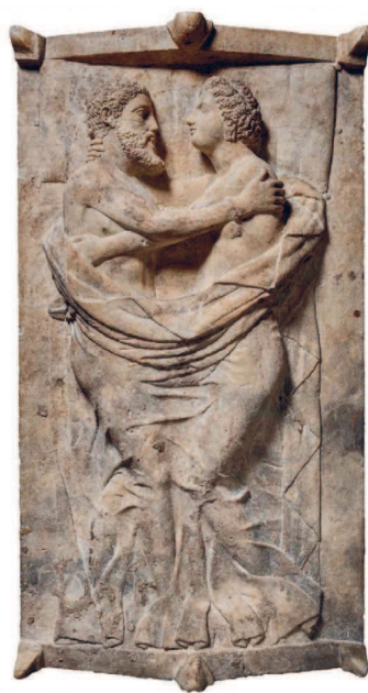
Крышка саркофага из Вульчи, IV век до н. э. Имена супругов Ларт Тетнис и Танквиль Тарнай, «изображен период сакрального брака в Загробном мире» 3