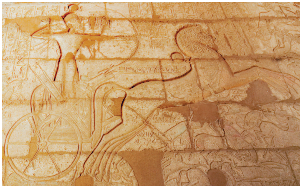
Рамзес II в битве при Кадеше, XIII век до н. э. Северный пилон второго двора Рамессеума, Луксор

позволило ему стать популярнее своих прижизненных конкурентов. Имхотеп, архитектор и астроном, живший в XXVII веке до н. э., был человеком такого же склада. Он, наряду со своей матерью-жрицей, которая по легенде родила его от духа, почитался в Египте на протяжении двух с половиной тысяч лет, по крайней мере до времен Клеопатры. После его образ был отождествлен с греческим богом Асклепием.