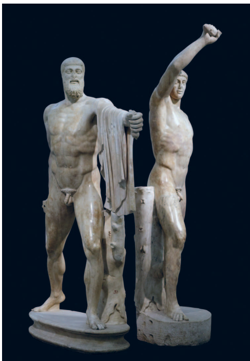
Тираноборцы. Римская копия 117–138 годов н. э. с греческого оригинала. Археологический музей, Неаполь

Демосфен, обращаясь к гордости сограждан, поднимал их на борьбу с превосходящими силами противника. Некоторое