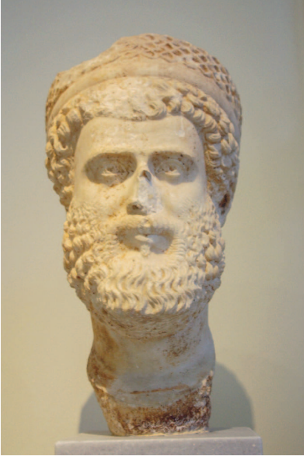
Бюст Юлиана Отступника (?). Археологический музей, Афины

тех времен, когда самым прибыльным видом деятельности была война. Заметим, что даже император-философ Марк Аврелий не мог позволить себе роскошь пацифизма.