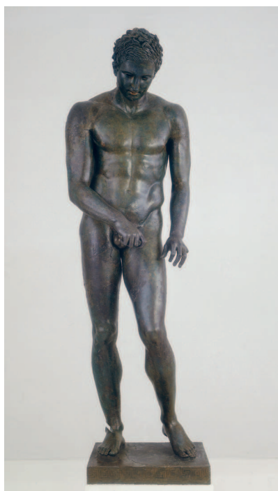
Хорватский Апоксиомен, II или I века до н. э. Мали-Лошнь, Хорватия