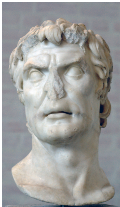
Скульптурный портрет I века до н. э. — II века н. э., ранее отождествлявшийся с Суллой, в настоящее время называемый «псевдо-Суллой». Мюнхенская глиптотека

Сам Сулла, прежде всего жестокий и алчный, а потом уже хитрый и лживый, хорошо иллюстрирует тип правителя