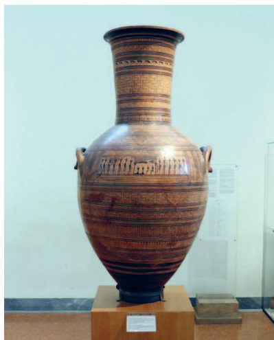
Большая дипилонская амфора, около 760–750 годов до н. э. Национальный археологический музей, Афины