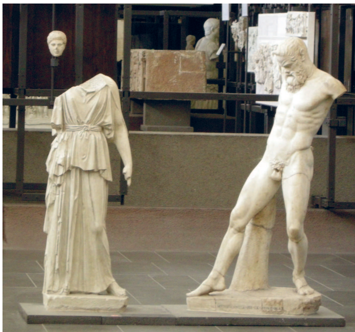
Мирон. Афина и Марсий. Реконструкция

Люди прошлого не были такими как мы, но ими точно так же двигали страх, жажда власти, гордыня, любовь, корысть и другие страсти. Так, например, возникновение скульптурной группы Мирона «Афина и Марсий» объясняли желанием афинян заклеймить презрением своих врагов беотийцев, любивших флейту. «Подобное “осовременивание” мифологического сюжета, соотнесение его с какими-либо реальными событиями или взаимоотношениями не было в древности редкостью. И в более поздние годы, в эллинистическом Пергаме, изображение на фризе алтаря борющихся богов и гигантов воспринималось как воплощение победы пергамских царей над напавшими на них галлами» 1 .