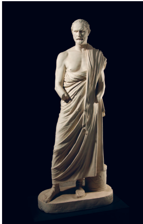
Статуя Демосфена, копия бронзовой статуи, воздвигнутой в 280 году до н. э. в Афинах. Новая Карлсбергская глиптотека, Копенгаген

Рассуждая о прошлом, мы используем воображение. Чем ближе к XXI веку, тем менее опозитивирована жизнь персонажей. Обыватель XIX века может скучать, а Демосфен нет. Демосфен не может делать глупостей или ковырять в носу. Сами слова «Коринф», «Дельфы», «Афины» выключают образованного человека из повседневности. Изучая прошлое, он пребывает в состоянии всеведения и отстраненности.