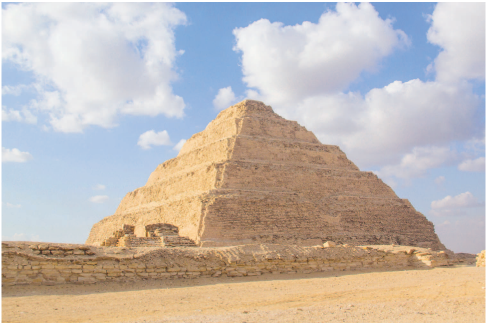
Ступенчатая пирамида Джосера, около 2650 года до н. э. Саккара