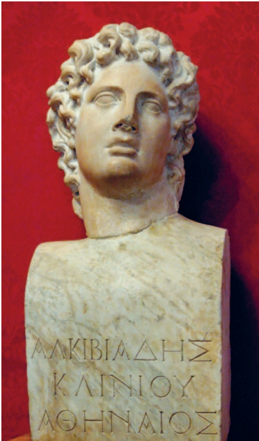
Бюст Алкивиада, IV век до н. э. Дворец консерваторов, Рим