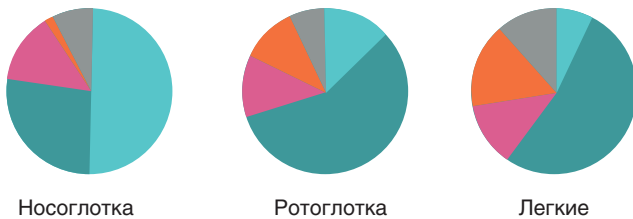
Рис. 2. Анатомия и микробная экология дыхательных путей. Показаны три основных уровня микробной экологии, включающие носоглотку, ротоглотку и легкие, с различными физико-химическими условиями, бактериальной нагрузкой и составом бактериальных сообществ на каждом уровне. Таксономические типы в составе микробиома включают Actinobacteria (голубой), Firmicutes (бирюзовый), Proteobacteria (малиновый), Bacteroides (оранжевый) и другие (серый) (адаптировано из [29, 48–52])

Уже здесь обозначим, что понимание процессов, которые приводят к нарушениям респираторного микробиома и, как следствие, к повышенной восприимчивости и тяжелому течению заболеваний органов дыхания, будет способствовать разработке новых терапевтических средств. До этого момента имеющиеся данные могли бы помочь нам