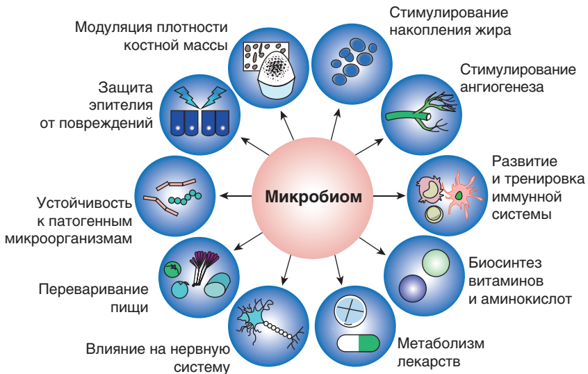
Рис. 1. Функции микробиома человека

В процессе постоянного взаимодействия с окружающей средой дыхательные пути, в частности легкие, обогащаются микроорганизмами. Этот факт был достоверно доказан как с помощью классических культуральных методов, так и с появлением новых молекулярно-генетических методов, таких как секвенирование [1]. Для врачей важно отметить, что обнаружение микроорганизмов в легких является постоянным фактом, подтверждаемым разными исследователями, и, более того, точно известно, что состав микроорганизмов дыхательных путей различается в норме и при патологии. Различный состав микроорганизмов присутствует при различных формах патологии и даже при различных стадиях одной патологии. Мы начинаем понимать, как формируется состав микроорганизмов дыхательных путей от внутриутробного этапа, с рождением и взрослением ребенка и как это влияет на дальнейшую жизнь и здоровье этого человека [2–3]. Более того, оси взаимодействия «кишечный микробиом — микробиом полости рта — микробиом дыхательных путей» усложняют и одновременно обеспечивают устойчивость системы «на-дорганизма» — человек и микроорганизмы в течение всей жизни первого. Современные функции микробиоты человека представлены на рис. 1.