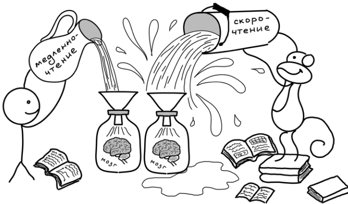
Рис. 1. Медленночтение и скорочтение

Не торопитесь читать эту книгу. Дальше я покажу, что скорость чтения мало влияет на скорость получения итогового результата (раздел 3.1). А еще дальше намекну, что путь к достижению некоторых результатов можно очень серьезно усложнить, если слишком быстро перейти к изучению нового материала (раздел 3.4).