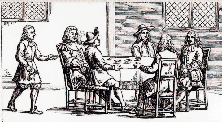
СЛЕВА Кофе на столе в кофейне. Англия, XVII в.

НА СТРАНИЦЕ СПРАВА В 1789 году кофе стал в прямом смысле «революционным напитком», когда Камиль Демулен вскочил на стол в парижском Café de Foy, призывая своих соратников к оружию.