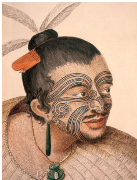
Полинезийский воин, украшенный татуировками. Гравюра. Ок. 1769