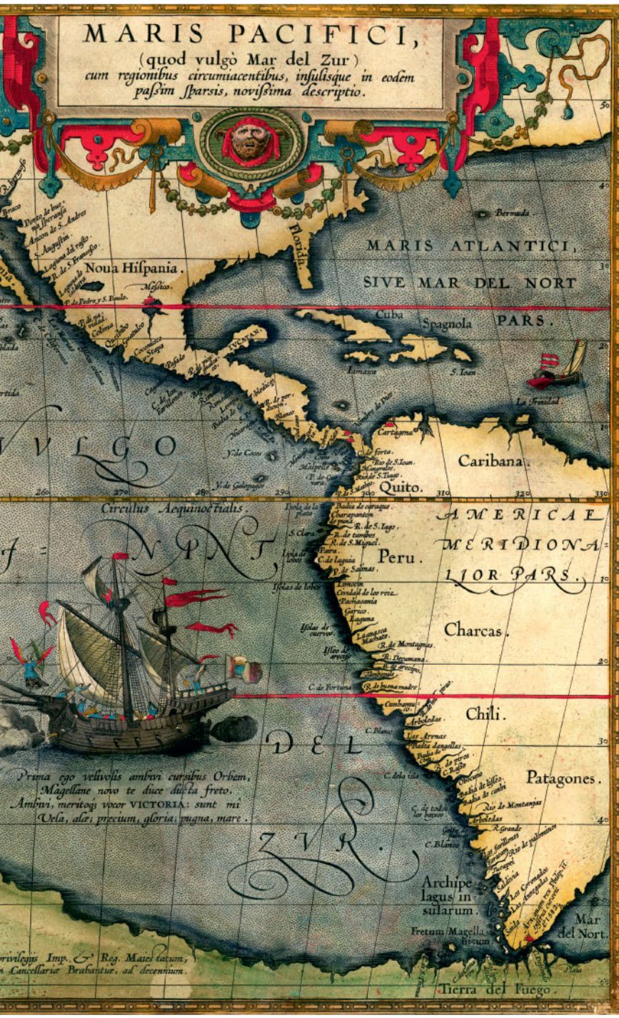
Карта Тихого океана из атласа «Theatrum orbis terrarum» («Зрелище круга земного») Абрахама Ортелия. Издание 1570 г.