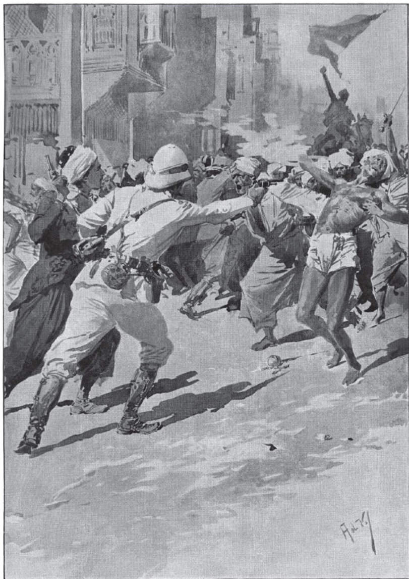
Выстрел из револьвера поразил первого марокканца, и он замертво рухнул на землю.