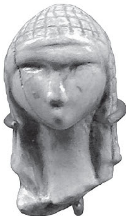
Женская головка из зуба лошади. Образец искусства эпохи палеолита из пещеры Мас-д'Азиль, департамент Арьеж. IX–VII вв. до н. э.

ло 600 г. до Рождества Христова, греки сделали торговый порт, через который транзитом шло олово, вывозимое из Британии. Марсель разрастался, и на побережье возникали новые греческие города: Никея (Ницца), Агатхэ Тюхэ (Агд), Антиполис (Антиб). Греки видоизменили провансальский пейзаж, и не только тем, что привезли оливковое дерево, но они привезли также и кипарис, фиговое дерево, виноградную лозу, акант и гранат. Битва Цветов, ежегодный праздник в Ницце и в других городах на Ривьере, восходит к греческим временам и, несомненно, связан с культом Деметры, Адониса или Персефоны. Персидская роза, попавшая через Грецию в Италию, была также привезена и в Прованс. Розовой эссенцией, которую производят сегодня в Грассе, мы обязаны греческим морякам и римским легионерам.