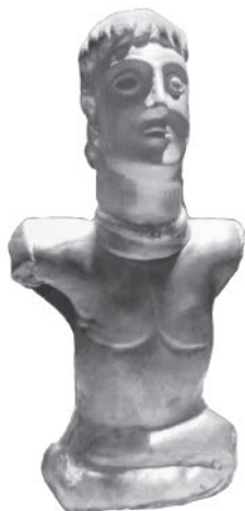
Гальская статуэтка бога или героя из Бурэ, департамент Уаза. III–I вв. до н. э. Бронза

между собой, потягивая местное ячменное пиво — сикера. Так как климат в Галлии был более холодным, чем в Италии, то они носили не тоги, а штаны и куртки из козьей шкуры. Римляне называли Цизальпийскую Галлию, жители которой были одеты как римляне, Gallia togata , а Трансальпийскую — Gallia comata или Gallia bracata , то есть «лохматой Галлией» или «Галлией в штанах». Деревянные сабо также поражали воображение римлян; они называли их gallicae , откуда к нам пришло слово галоши . Галлы были охотниками и пастухами, но занимались также и земледелием; в основном они питались дичью, свининой и медом, а эта пища была совсем не похожа на пищу, привычную для римских солдат, которые жаловались на мясную диету, навязанную им интендантством.