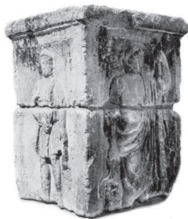
Жертвенник галлороманского храма Юпитера. Лютеция. Фрагмент. I в.