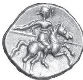
Кельтская монета. Бассейн Роны. I в. до н. э.

13. И тем не менее в первые годы после завоевания Галлия процветала. Именно в тот период появилась у галло-римлян склонность к сельскому хозяйству и любовь к земле, унаследованные позднее французами. Можно только вообразить те радости жизни первых поколений, которые, в противоположность анархии, обеспечивал им римский мир ( Pax Romano ). Наконец-то в стране появились дороги, границы, военная полиция. Повсюду по пути следования римлян возводились дома нового, средиземноморского типа, виллы, украшенные колоннами и портиками, статуями из мрамора и обожженной глины. Жители городов жили в незнакомой дотоле роскоши: общественные бани, разнообразие спектаклей. Еще несколько десятилетий назад галлы обитали среди лесов в глинобитных хижинах. Теперь же галло-римляне распахивали и обрабатывали новые земли, богатели и продавали плоды своих земель Риму, всегда готовому покупать галльское зерно (дешевизна которого поражала Полибия) и галльские копчености. Галлия становилась «Северным Египтом» (Г. Ферреро).