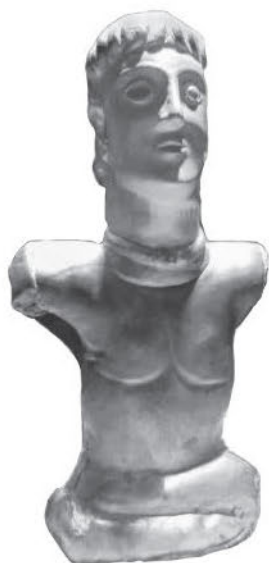
Галльская статуэтка бога или героя из Бурэ, департамент Уаза. III—I вв. до н. э. Бронза

провинция), — говорит Плиний, потому что природа, растительность и климат напоминали ему Италию. Там возникали прекрасные города, такие как Арль, Ним, Оранж, города с термами, форумами и аренами. Вскоре галлы в своей еще независимой Галлии ощутили угрозу и с востока от германцев, чьи воинственные и жадные племена скапливались по ту сторону Рейна, и с юга от римлян. Две группы римских граждан — торговцы и военные — требовали завоевания Галлии. Торговцы жаждали рабов, поместий и рудников; военные рассчитывали стяжать там славу и политический авторитет; они утверждали, что для защиты Рима от германцев необходимо прикрыть фланги Италии в Галлии. Благодаря одному полководцу, политическому деятелю и писателю по имени Юлий Цезарь мы имеем описание Галлии конца 50-х гг. до н. э. Читая эти описания, необходимо помнить о некоторых неточностях, неизбежно проникающих в доклады разведчиков о столь малоизвестных племенах. Но в юности наставником Цезаря был Антифон — галл по происхождению, а позднее военные походы позволили самому Цезарю пересечь всю страну.