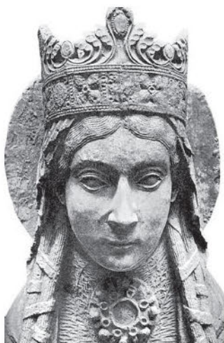
Клотильда Бургундская. Фрагмент скульптурного декора собора Нотр-Дам в Корбейле. XII в.

Христос не был ни полностью человеком, ни полностью Богом, что представлялось очень опасной ересью, которая делала из Христа полубога и под предлогом унитаризма поощряла некий политеизм. Но Хлодвиг под сильным влиянием Клотильды, своей супруги-католички, принял христианство [в ортодоксальной форме. — Примеч. перев. ], что обеспечило ему могущественную поддержку епископов, приверженных Троице, для которых основной задачей была победа в Галлии над арианством и всеобщее признание единосущности Бога Отца и Бога Сына. Но для Хлодвига «триединство Троицы представлялось делом политическим и военным» (Ф. Функ-Брентано). И он прилагал постоянные усилия для достижения своей цели. Хлодвиг был безжалостным циником, его возвышению способствовали как хитрость и убийства, так и успешные сражения. «Ежедневно, — наивно объясняет Григорий Турский, — Бог поражал своей рукой врагов Хлодвига и увели-