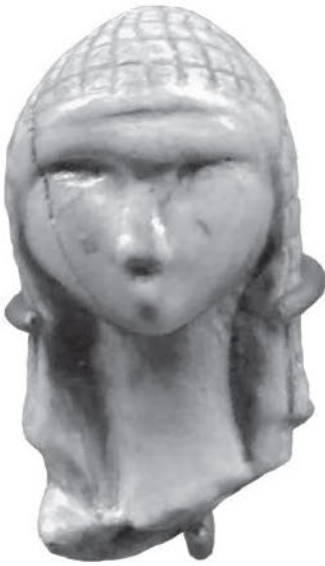
Женская головка из зуба лошади. Образец искусства эпохи палеолита из пещеры Мас-д'Азиль, департамент Арьеж. IX–VII вв. до н. э.

2. Никогда не существовало народа французской национальности. Та территория, которая является нынешней Францией, располагалась на краю Европейского континента. Здесь завершались вторжения, и здесь останавливались и поселялись завоеватели. В конце первого тысячелетия до нашей эры в Альпах проживали лигуры, в Пиренеях — иберы, от которых, возможно, и происходят современные баски. По Средиземному морю приплывали финикийские моряки; Монако — это финикийское слово, означающее отдых, остановка . Семитские купцы обменивали на рабов жемчуг, гончарные изделия и яркие ткани. Позднее греческие мореходы основали на побережье колонии и привезли с собой цивилизацию Востока, религиозные веяния, таинства, деньги, культуру оливковых деревьев и более совершенный язык. Из своей главной колонии Массилия (Марсель), основанной моряками из ионийской Фокеи около 600 г. до Рождества Христова, греки сделали торговый порт, через который транзитом шло олово, вывозимое из Британии. Марсель разрастался, и на побережье возникали новые греческие города: Никея