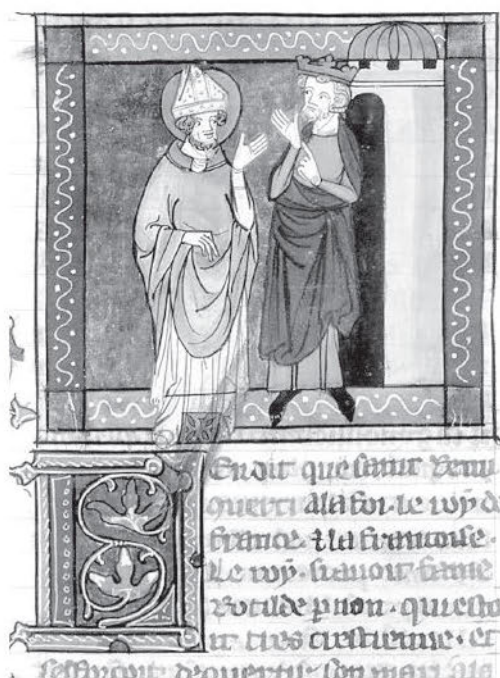
Король Хлодвиг и св. Ремигий. Французская миниатюра. XIV в.