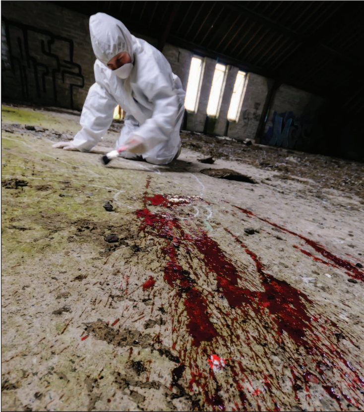
Офицер, работающий на месте преступления, изучает следы крови на земле и область вокруг них.

В помещении следы пролитой крови намного легче анализировать, чем на открытом воздухе, поэтому они могут дать важную информацию о последовательности произошедших событий (см. главу «Написано кровью»).