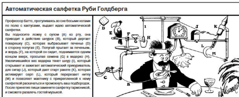
Рис. 1. Передача вероятностных, или контингентных, расчетов. Карикатурист XX века Руби Голдберг развлекал публику, изображая ситуации пассивного отклика для решения различных рутинных задач — например вытереть лицо салфеткой, прихлопнуть муху или выдать пасту на зубную щетку. Хотя создание подобных сложных конструкций вместо элементарного ответного действия — простого вытирания лица салфеткой — кажется странным (как показано на этой карикатуре), люди постоянно изобретают способы избегания обычных действий для получения важных ресурсов, необходимых для их благополучия. Интересно, не разрушат ли в будущем такие пассивные отклики способность человека принимать умные решения и выдавать эффективные реакции? © TM Rube Goldberg Inc.; rubegoldberg.com

ходящее в нашей жизни часто зависит от тех действий, которыми мы руководствуемся на основании собственного опыта. Отличаясь от элементарных вероятностных расчетов, хорошо настроенные контингентные расчеты требуют от нас личной заинтересованности и участия. Прошлый опыт становится настоящим компасом, позволяющим пройти через те неопределенности, с которыми мы сталкиваемся в жизни. Для предсказания продолжительности жизни демографической группы нужно иметь достаточно данных, чтобы создать точные таблицы дожития 1 ; но лишь опираясь на собственный опыт,