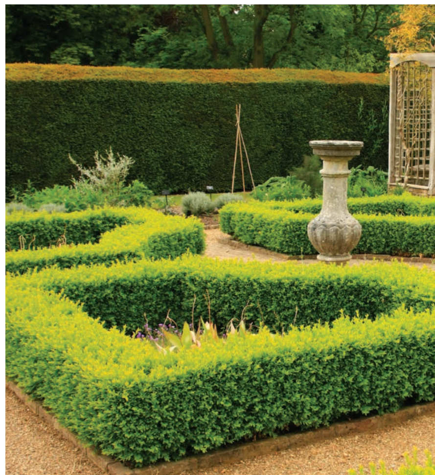
Стриженные самшитовые боскеты — характерный элемент формального сада

Парки итальянского барокко и более поздние французские сады времен Андре Ленотра изобиловали декоративными деталями: скульптурными композициями,