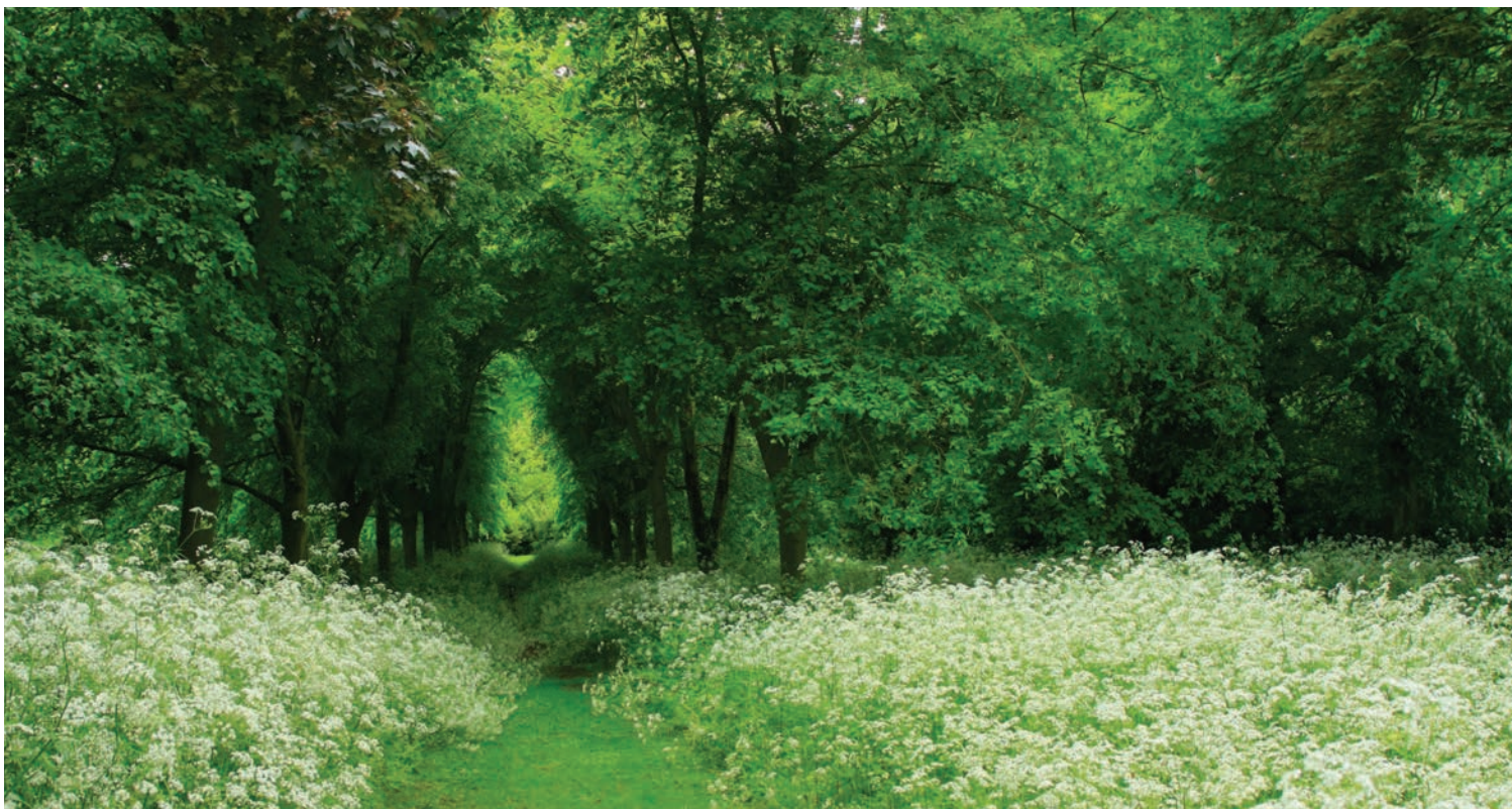
▾ Затененная аллея пейзажного парка