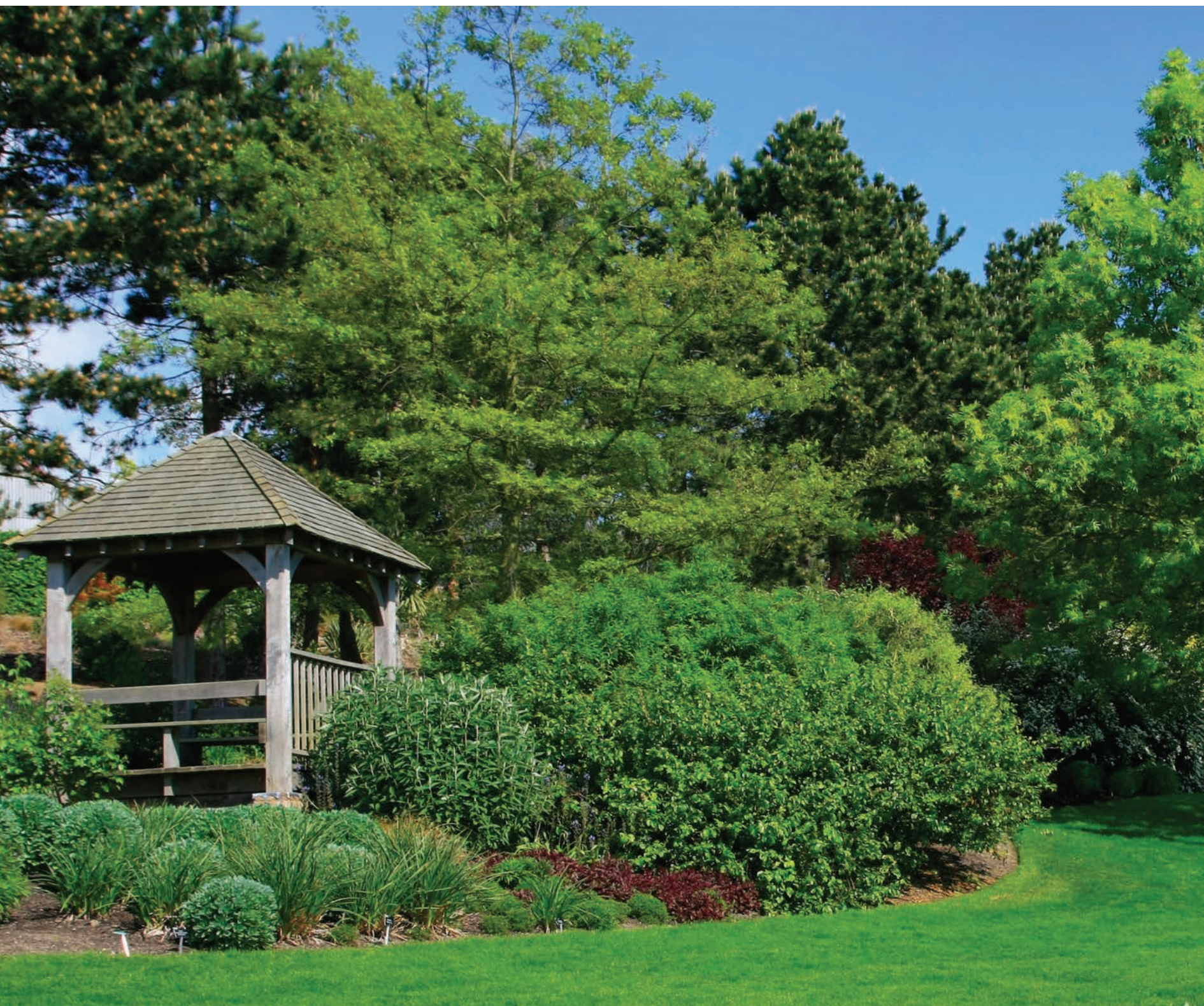
▢ Беседки, газебо, миловиды — крытые видовые точки в саду