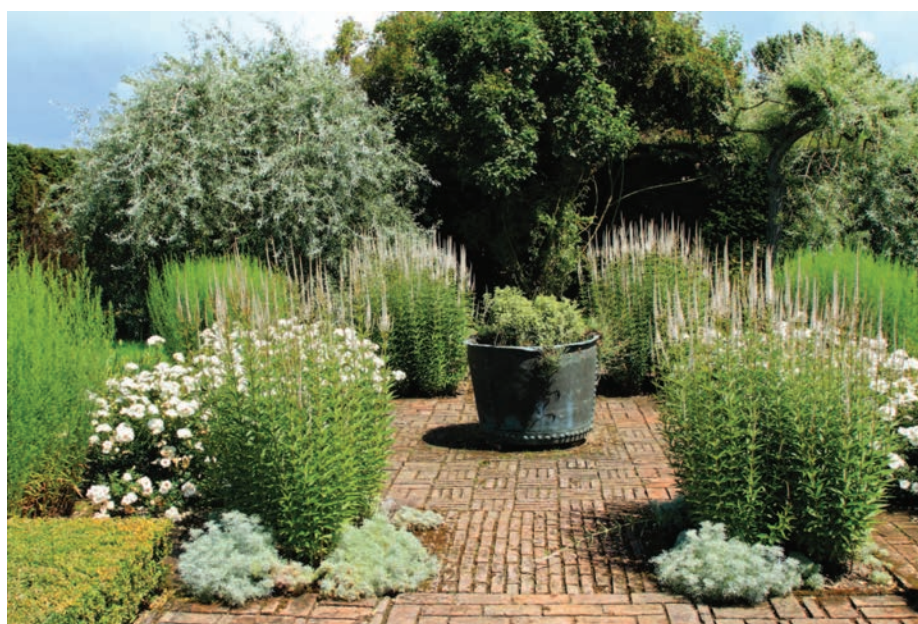
Старинное свинцовое кашпо — центральный организующий элемент композиции