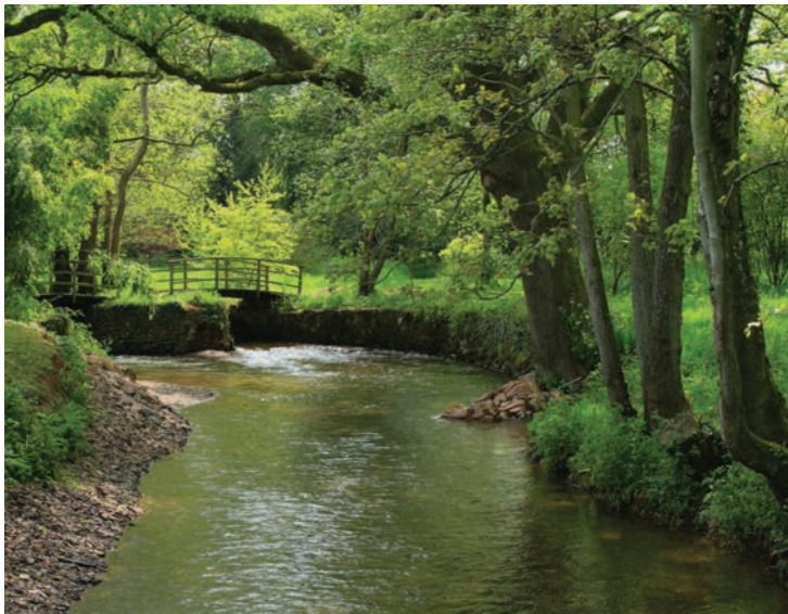
Вода в естественных проявлениях украшает ландшафтные сады

китайские сады и китайское искусство, в результате чего даже сформировалось художественное течение, носящее название шинуазри, несколько позже в России этот стиль называли китайщиной.