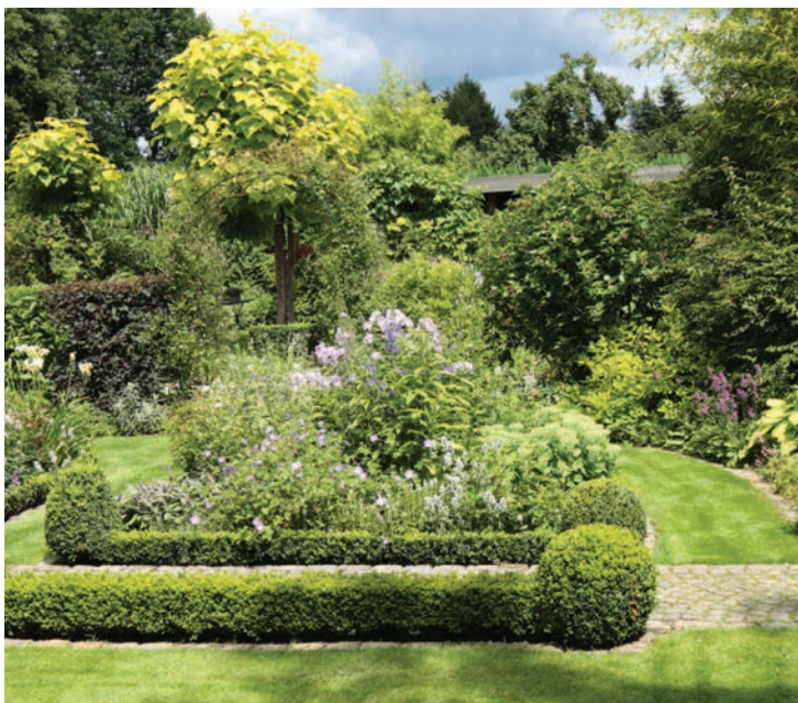
Изгороди из стриженных растений всегда эффектно смотрятся, но требуют немало ухода

внимательно приглядится к планировке приусадебных участков в загородных поселках и садовых товариществах не только центральных, но и многих других областей России. Однако нередко по прошествии некоторого времени обозначенный подход к обустройству участка оборачивается частичной или полной переделкой придомовой территории.