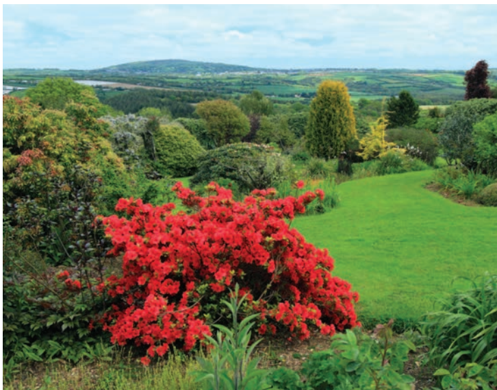
Природный ландшафт становится продолжением пейзажного сада

Расцвет пейзажного направления садово-паркового искусства во времена Просвещения по праву связывают с Англией, где творили такие великие мастера свободных ландшафтов, как Уильям Кент, Ланселот Браун, Хемфри Рептон, Александр Поуп. Первым из них по праву считают У. Кента, по поводу которого существует хорошо известное и очень емкое изречение: «Он перескочил через садовую изгородь и осознал, что вся природа — это сад». Большое распространение пейзажный, или английский, стиль садоводства получил и в России, где с его становлением связаны имена Ч. Камерона, П. Гонзаго, Ф. Растрелли, Н. Львова и А. Болотова.