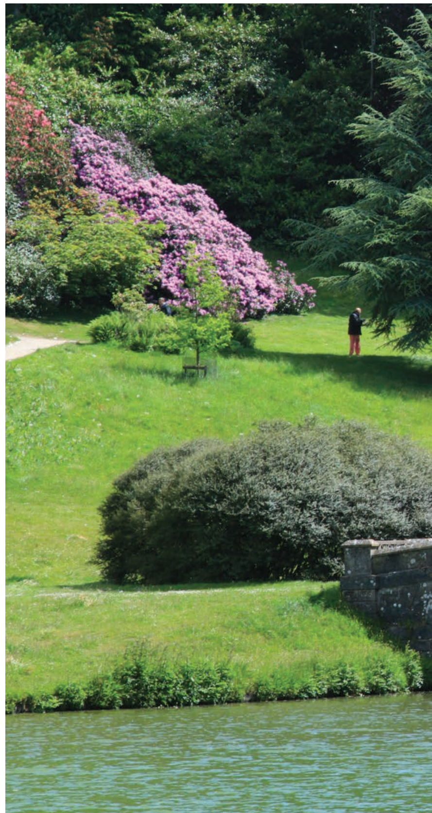
Stourhead Garden — классика английского пейзажного сада

Отдавая предпочтение тому или иному садовому стилю, хозяева участка должны одновременно учитывать много различных факторов, и в первую очередь собственные вкусовые пристрастия и особенности характера членов семьи. Играют роль также размер и конфигурация участка, рельеф местности, место