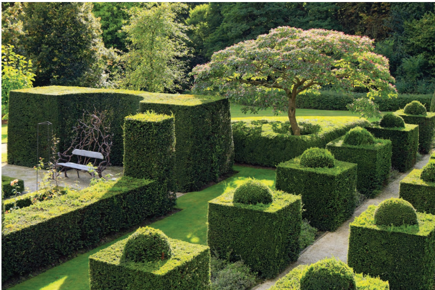
Регулярный участок, гармонично вписанный в пейзажный сад