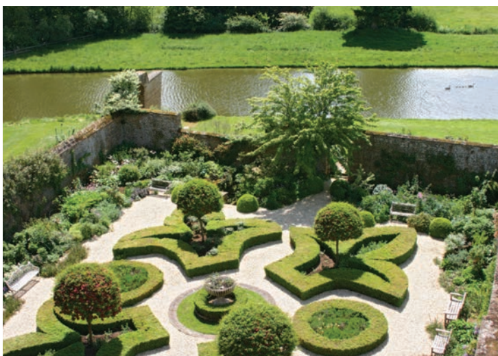
Закрытый сад с формальной планировкой

Совсем не обязательно заказывать проект в ландшафтной мастерской, хотя при удачном стечении обстоятельств это существенно облегчает решение проблем, связанных с дизайном сада, и позволяет создать сад качественно иного уровня.