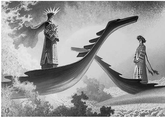
Аврора на картине художника Б. Ольшанского «У небесного причала»

АВСЕНЬ м. — первый день весны, 1 марта, коим прежде начинался год; ныне название это перенесено на Новый год и на Васильев вечер, канун Нового года. В песнях: тусень, титусень, туа-сень, таусель; щедрованье или обсев хозяина житом, с пожеланьями; свиная голова к обеду; вечером гаданья.