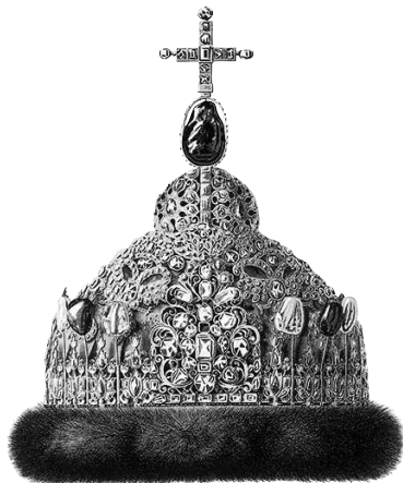
Ф. Солнцев. Алмазная шапка царя Петра Алексеевича

АЛМАЗ м. — первый по блеску, твердости и ценности из дорогих (честных) камней; алма́нт, бриллиант. Алмаз, чистый углерод в гранках (кристаллах), сгорает без остатка, образуя угольную кислоту. Алмаз название общее; бриллиант — более ценный по величине и полной грани; алмаз неполной грани, плоский — бывает в глухой (с исподу) оправе; розетка, искра — самый мелкий алмаз. Алмаз стекольщик — неграненый, сырой, в оправе на ребро, на природную грань. Свой глаз алмаз — свой призор. Алмаз алмазом режется, вор вором губится — в сыщики берут такого же вора. Алмаз ангельская слеза — поверье.