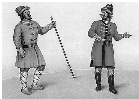
Азям и кафтан

АЗБУКА ж. — алфавит, абевега, стар. букваца; собрание в порядке всех письмен, букв, какой-либо грамоты; азбука славянская — собственно букваца, кириллица, для отличия от глаголицы, вероятно, придуманной папистами; || учебник грамоты, букварь; || начальные основания какой-либо науки. Азбуку учат, во всю избу кричат. || Роспись, оглавление, указатель в азбучном порядке, алфавит. Азбука имен. Азбучник м. -ница ж. — учебник азбуки, начал грамоты. Азбукóвина ж. — чужие, нерусские, незнакомые письмена; уродливые, ломаные.