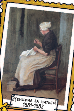
ЖЕНЩИНА ЗА ШИТЬЕМ 1881-1882