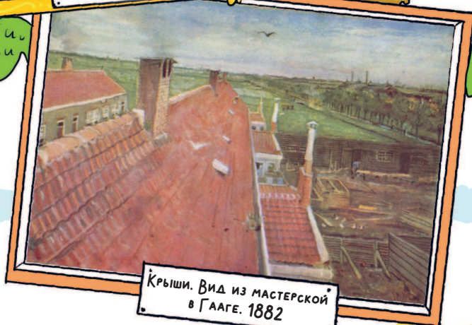
КРЫШИ. ВИД ИЗ МАСТЕРСКОЙ В ГААГЕ. 1882