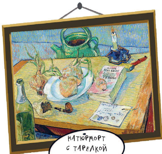
НАТЮРМОРТ С ТАРЕЛКОЙ И ЛУКОВИЦАМИ