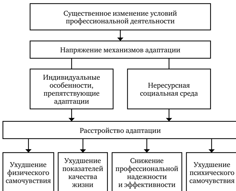
Рис. 1. Схема возникновения и проявления расстройства адаптации

Факторы, усугубляющие реакцию организма на профессиональный стресс, и последствия их негативного воздействия изображены на рис. 1.