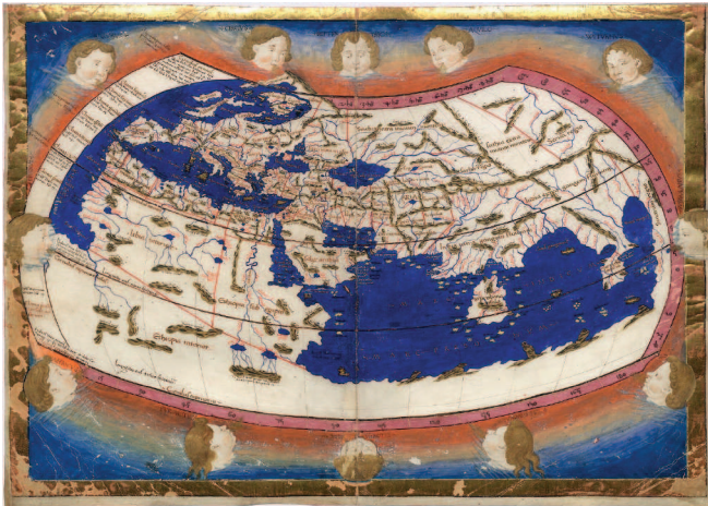
Карта мира Птолемея (II век) в реконструкции Николая Германа (XV век)

XVI век проверял на прочность все, что казалось незыблемым. Великие географические открытия расширили границы бытия и оказалось, что старый, хорошо изведанный свет — это еще не вся вселенная. Где-то за океаном были обнаружены острова и материки с невиданными культурами. Все боль-