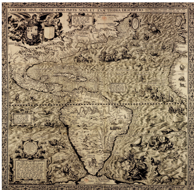
Карта Северной и Южной Америки Диего Гутьерреса с изображением Испанской империи в период ее расцвета. Сделана по заказу Филиппа II

ше завоевывала ученые умы теория Коперника, которая утверждала, что Земля — шар, а не плоскость, и шар этот, представьте себе, вращается вокруг Солнца. Джордано Бруно вдруг заявил, что твердых небесных сфер не существует. Его сожгли в Риме, на Кампо ди Фьори в 1600 году (правда, не только и не столько за это), но никакие костры инквизиции уже не могли остановить прогресс. Человеческое знание окончательно вышло за пределы видимого и слышимого. Теории прошлого — представления Аристотеля или Птолемея,