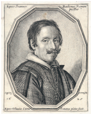
Оттавио Леони. Портрет Джованни Бальоне