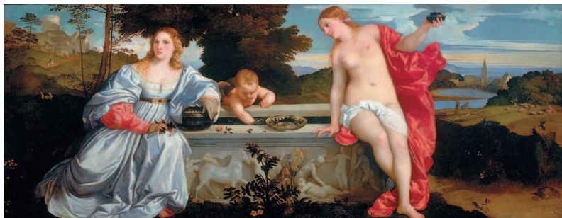
Тициан. Любовь небесная и Любовь земная. Ок. 1514

мастеров и добиваясь портретного сходства, рисуя с натуры. Разумеется, он изучал картины и фрески, украшавшие миланские церкви. И, конечно, не прошел мимо «Тайной вечери» Леонардо, почитавшейся шедевром еще при жизни автора. По всей видимости, Петерцано был отличным учителем, иначе откуда бы что взялось? Другое дело, что, увы, безуспешны оказались попытки современных ученых отыскать рисунки молодого Караваджо в архиве его учителя (он хранится в миланском замке Сфорцеско). И поэтому кажется,