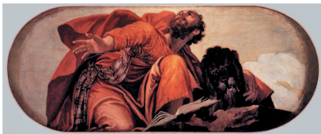
Паоло Веронезе. Святой Марк. 1556/57. Церковь Сан-Себастьяно, Венеция

мастеров и добиваясь портретного сходства, рисуя с натуры. Разумеется, он изучал картины и фрески, украшавшие миланские церкви. И, конечно, не прошел мимо «Тайной вечери» Леонардо, почитавшейся шедевром еще при жизни автора. По всей видимости, Петерцано был отличным учителем, иначе откуда бы что взялось? Другое дело, что, увы, безуспешны оказались попытки современных ученых отыскать рисунки молодого Караваджо в архиве его учителя (он хранится в миланском замке Сфорцеско). И поэтому кажется,