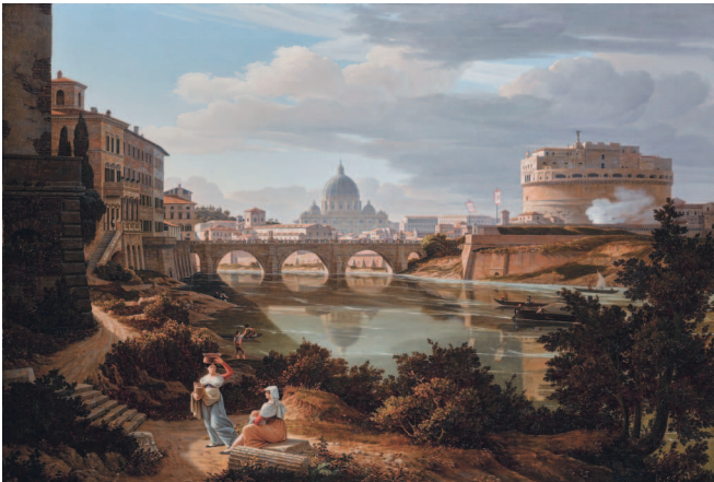
Рудольф Вигманн. Сан-Пьетро и Кастель-Сант-Анджело. 1834

Увидев Рим и как он в блеск убран, Дивились, созерцая величавый Над миром вознесенный Латеран...*