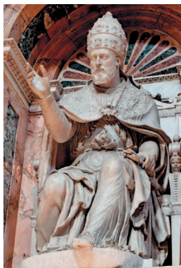
Статуя папы Климента VIII. Капелла Боргезе, собор Санта-Мария-Маджоре, Рим

Разумеется, Юбилейные годы приносили папской казне значительный доход. В городе оживлялись строительство и торговля. Папы, которые были не только духовными лидерами Европы, но и светскими правителями Папской области, стали объявлять о юбилеях чаще — каждые полвека, затем каждые 33 года (в память о земной жизни Христа), каждые 25 лет. Кроме того, понтифики неоднократно пользовались правом назначать внеочередные Юбилейные годы (последний раз это случилось в 2016 году — Франциск Первый назвал его Годом Божественного Милосердия).