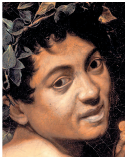
Больной Вакх. 1593/94. Галерея Боргезе, Рим. Фрагмент

с корзиной фруктов», они находятся в собрании Виллы Боргезе в Риме. Оба полотна оказались в коллекции кардинала-племянника Шипионе Боргезе в 1607 году результате настоящей спецоперации. Неистовый коллекционер, обладавший огромной властью, воспользовался интригами в художественном сообществе, чтобы во время ареста (под надуманным предлогом) Кавалера д'Арпино описать и конфисковать его имущество. В том числе, коллекцию картин, среди которых были и ранние работы Караваджо. Художник ра-