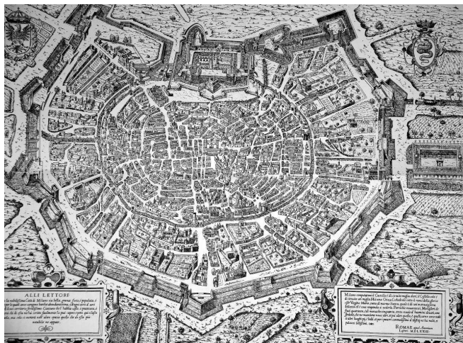
Карта Милана. XVI век

же году Лючии Аратори не стало. Впрочем, юноша не остался один в этом мире. Семья Меризи была близко связана с богатым и знатным родом Колонна, представители которого продолжали участвовать в жизни Караваджо.