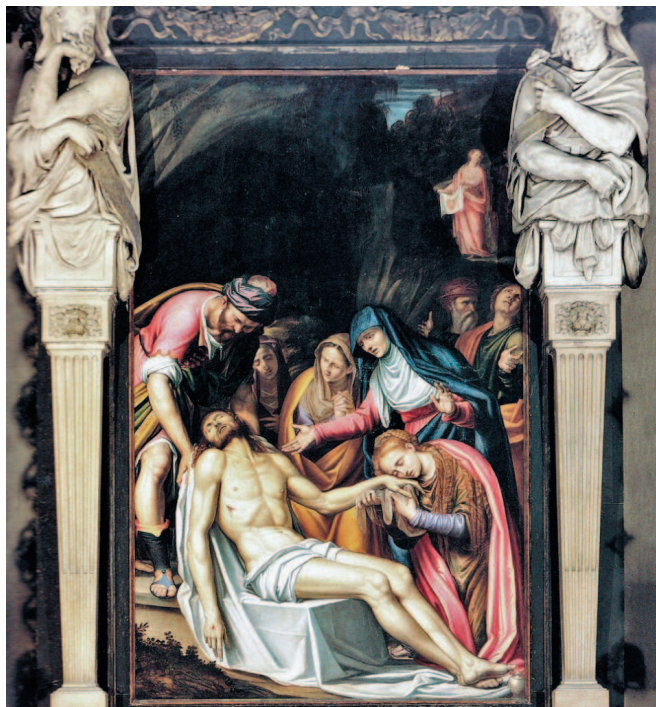
Симоне Петерцано. Пьета. 1584

любие мальчика своими рассказами. Наверняка от Петерцано пришел интерес и к другим венецианцам — Веронезе и Джорджоне, к их колориту и натуралистичности в изображении человеческого тела. Юный Меризи наверняка делал здесь все, чем обычно занимались подмастерья художников, — мыл полы, развешивал картины, измельчал для красок минералы и смешивал их с растительным маслом, и рисовал, рисовал, рисовал — прежде всего, копируя работы старых