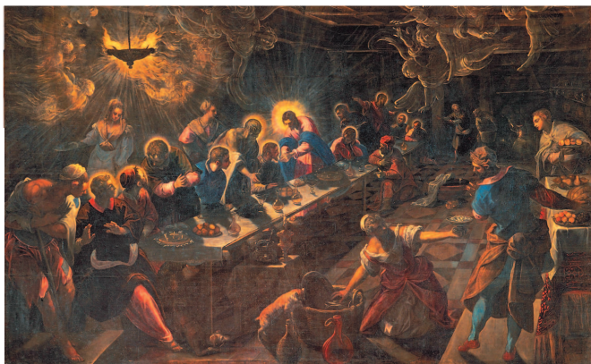
Тинторетто. Тайная вечеря. 1592/94. Церковь Сан-Джорджо Маджоре, Венеция

влияние не только уже упомянутых венецианцев, но и ломбардцев: Морони, Савольдо, Моретто и других. В 1591–1592 годах имя Меризи промелькнуло в нескольких судебных и нотариальных документах, после чего — опять тишина. Долгое время считалось, что тут-то амбициозный художник и отправился в Рим, однако открытия последних лет показывают, что это произошло, скорее всего, гораздо позже — в конце 1595 или начале 1596 года*.