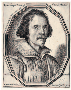
Оттавио Леони. Портрет Кавалера д'Арпино

способствовал его распространению). Наконец, именно при Клименте VIII в Риме взошел на костер Джордано Бруно.