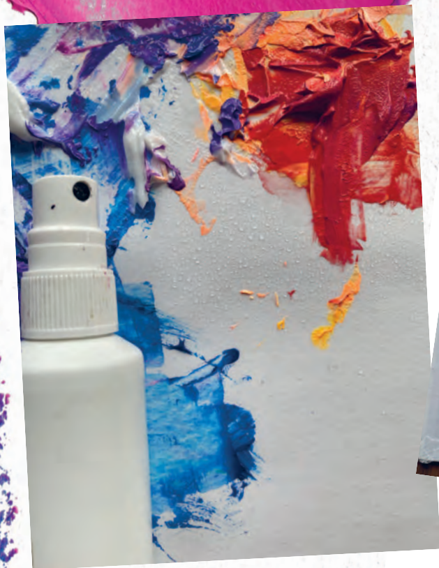
Рисунок 7 / Figure 7