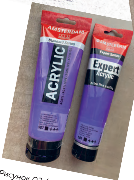
Рисунок 03 / Figure 03