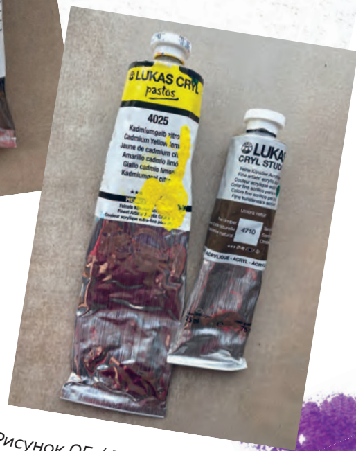
Рисунок 05 / Figure 05