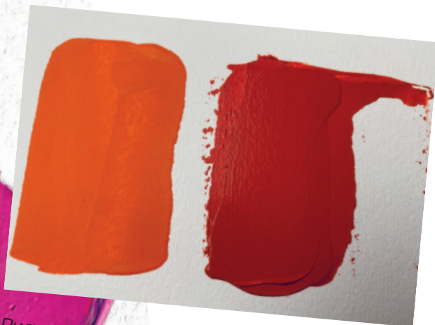
Рисунок 3.2 / Figure 3.2