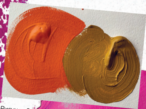
Рисунок 3.1 / Figure 3.1