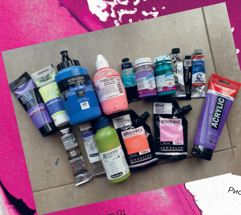
Рисунок 01 / Figure 01