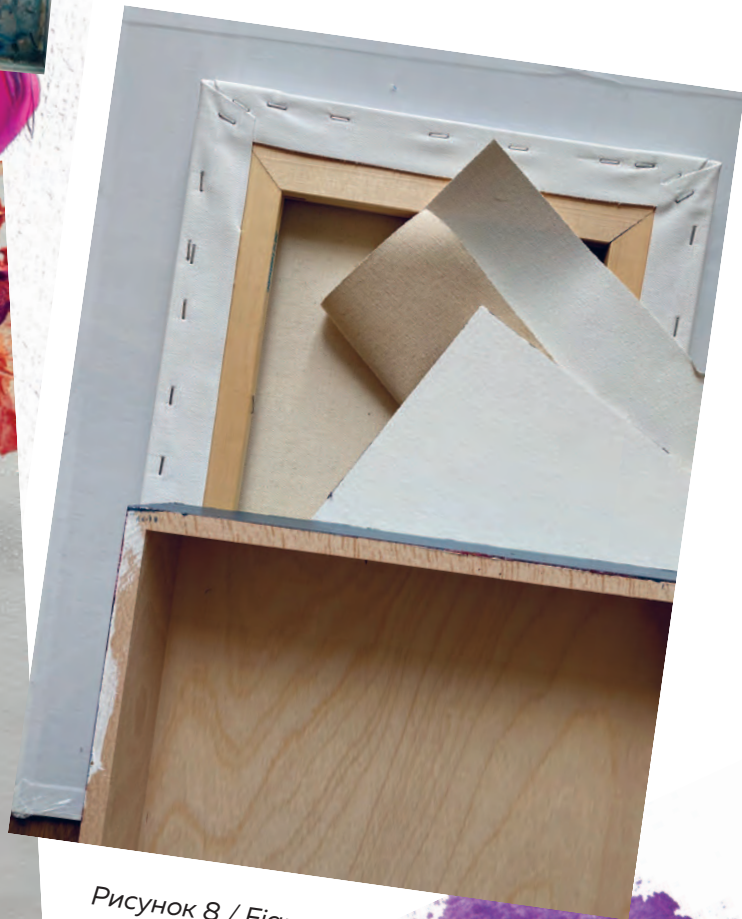
Рисунок 8 / Figure 8