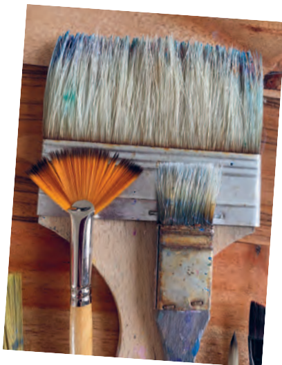
Рисунок 4.5 / Figure 4.5