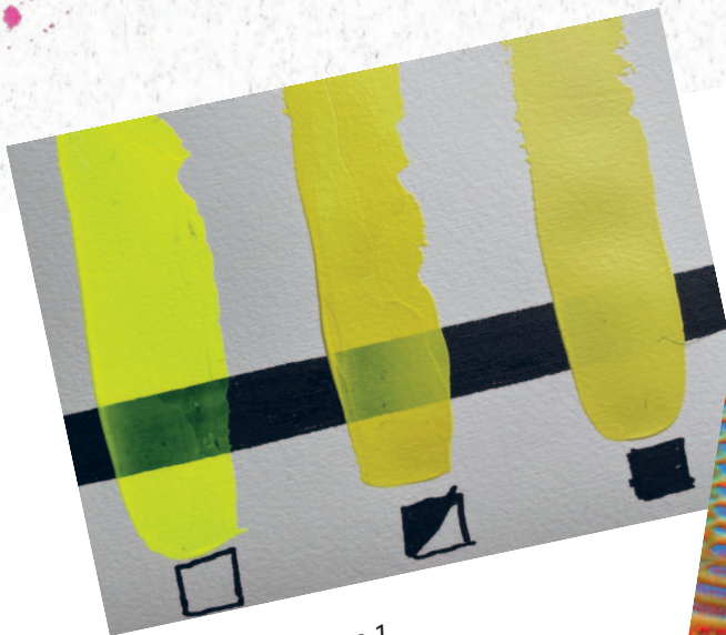
Рисунок 1 / Figure 1