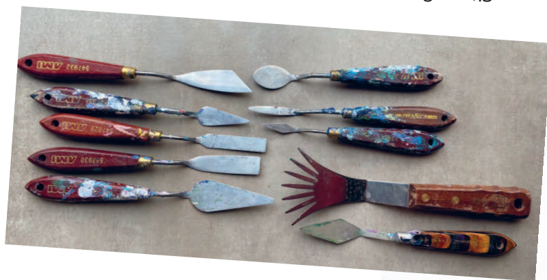
Рисунок 6 / Figure 6