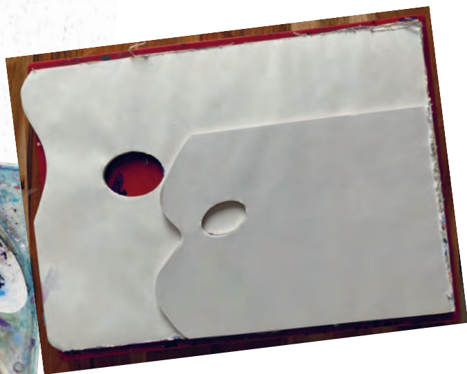
Рисунок 6.2 / Figure 6.2