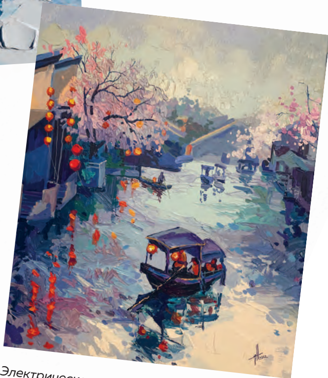
Электрическая лампа / Electric lamp