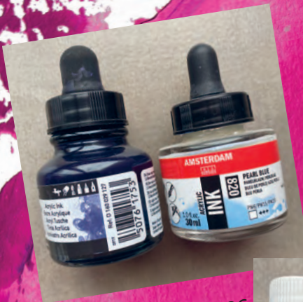
Рисунок 06 / Figure 06