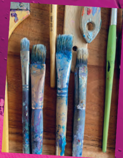
Рисунок 4.1 / Figure 4.1