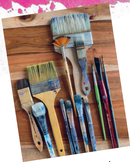
Рисунок 4.4 / Figure 4.4