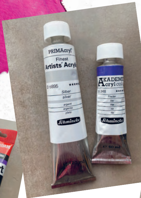
Рисунок 04 / Figure 04