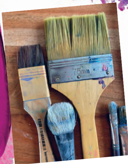
Рисунок 4.2 / Figure 4.2