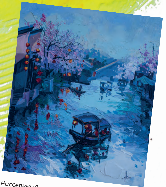
Рассеянный дневной / Diffused daylight