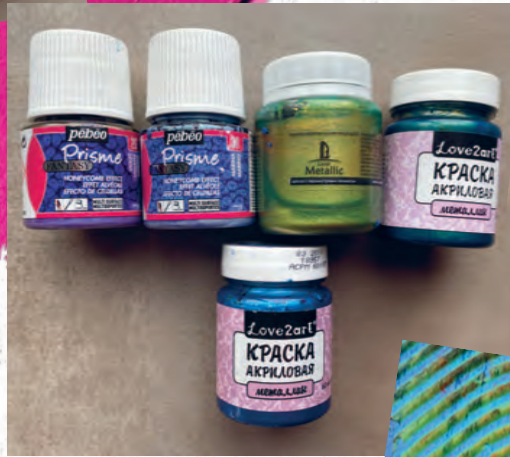
Рисунок 07 / Figure 07