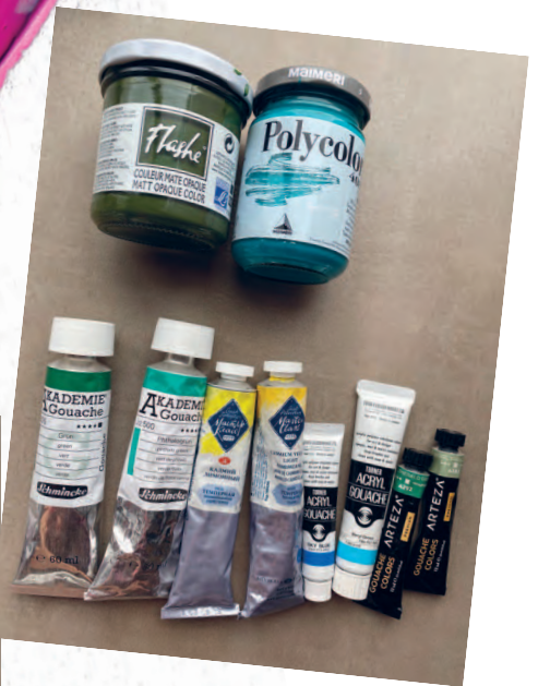
Рисунок 08 / Figure 08