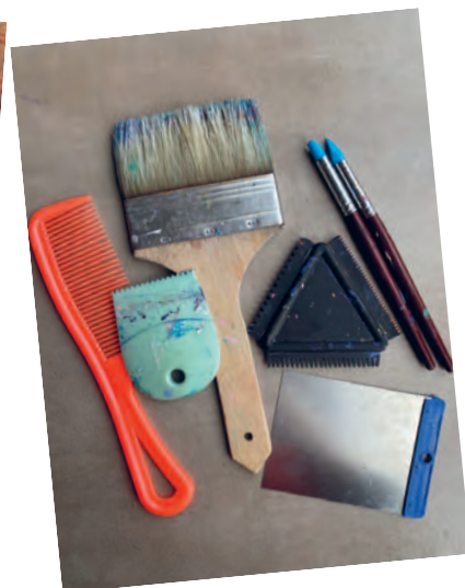
Рисунок 5 / Figure 5