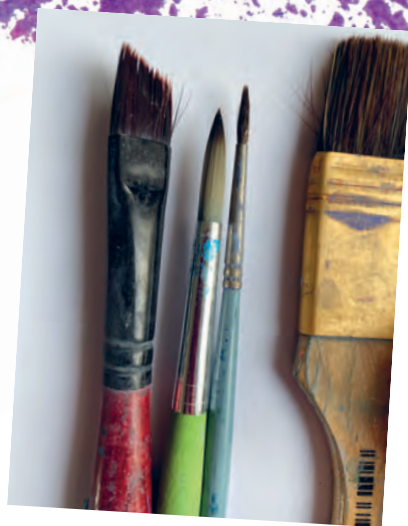
Рисунок 4.3 / Figure 4.3