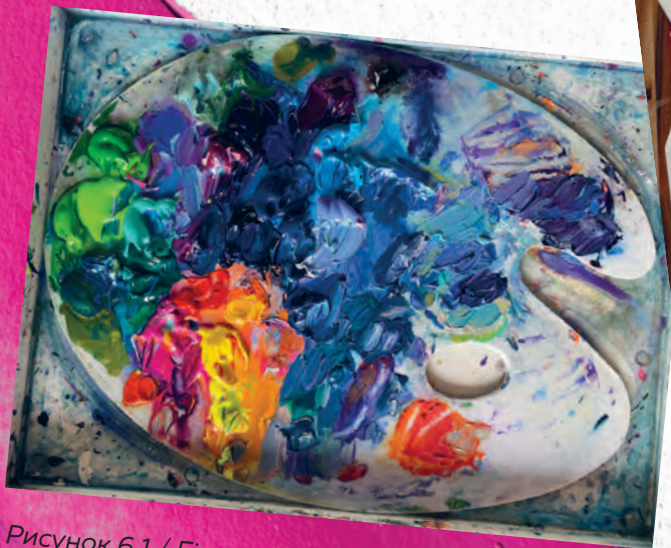
Рисунок 6.1 / Figure 6.1