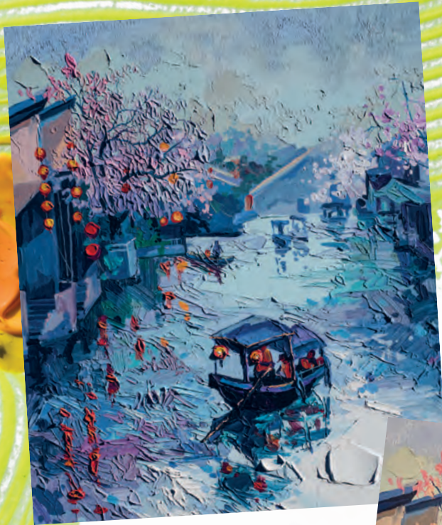
Солнечный свет / Sunlight