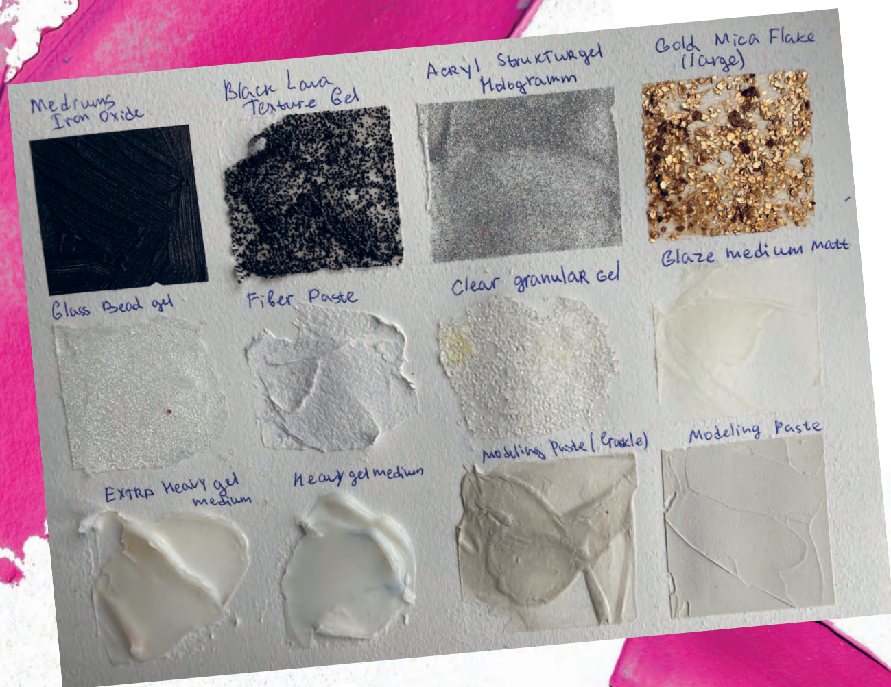
Рисунок 4 / Figure 4