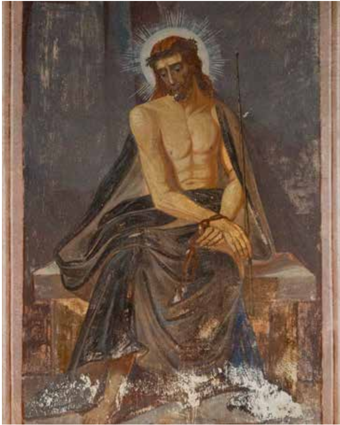
Христос в темнице