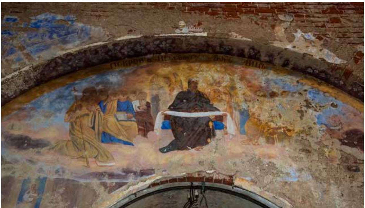
Покров Пресвятой Богородицы