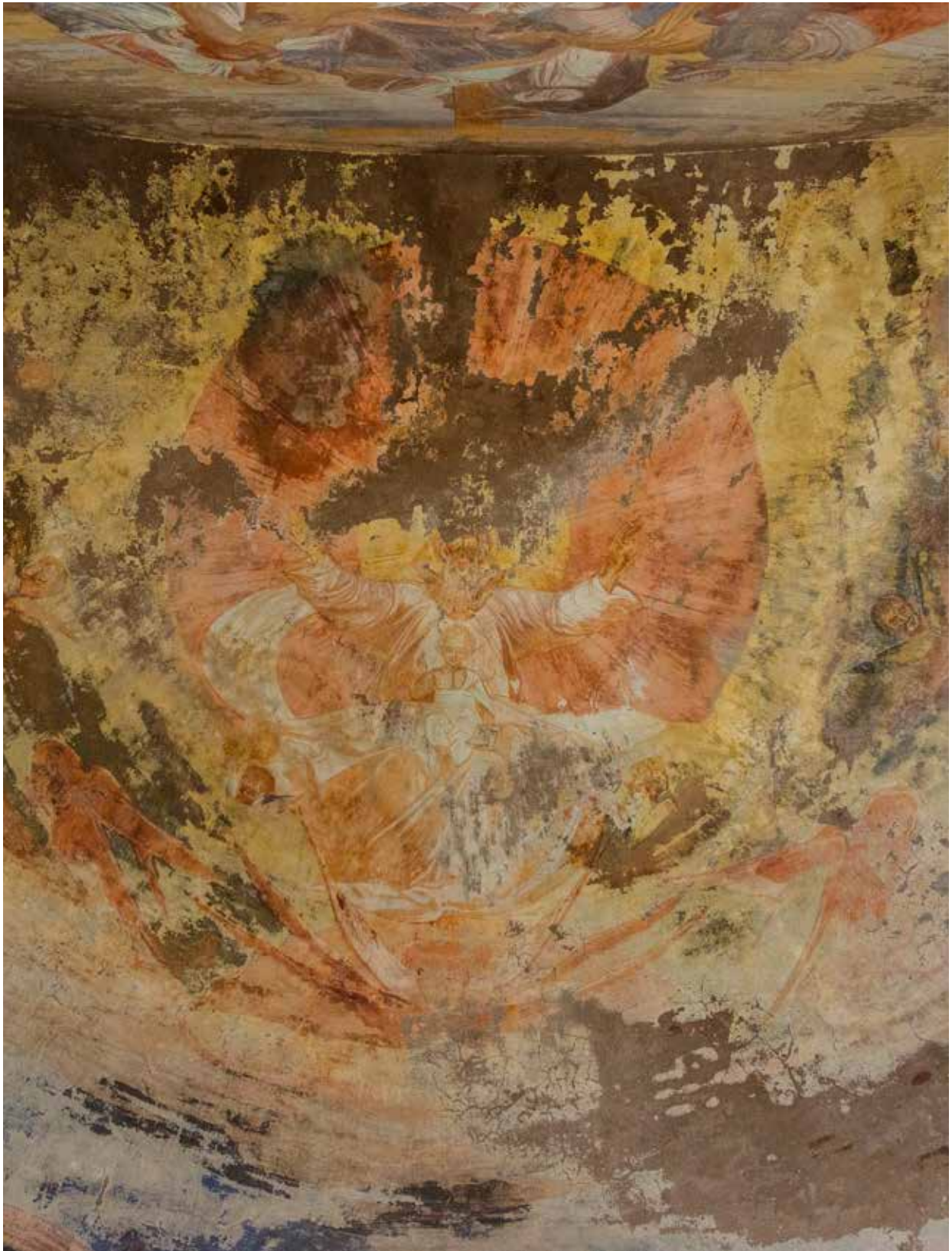
Свод апсиды, Святая Троица