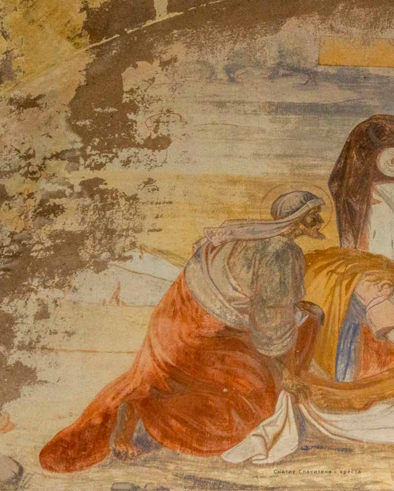
Снятие Спасителя с креста