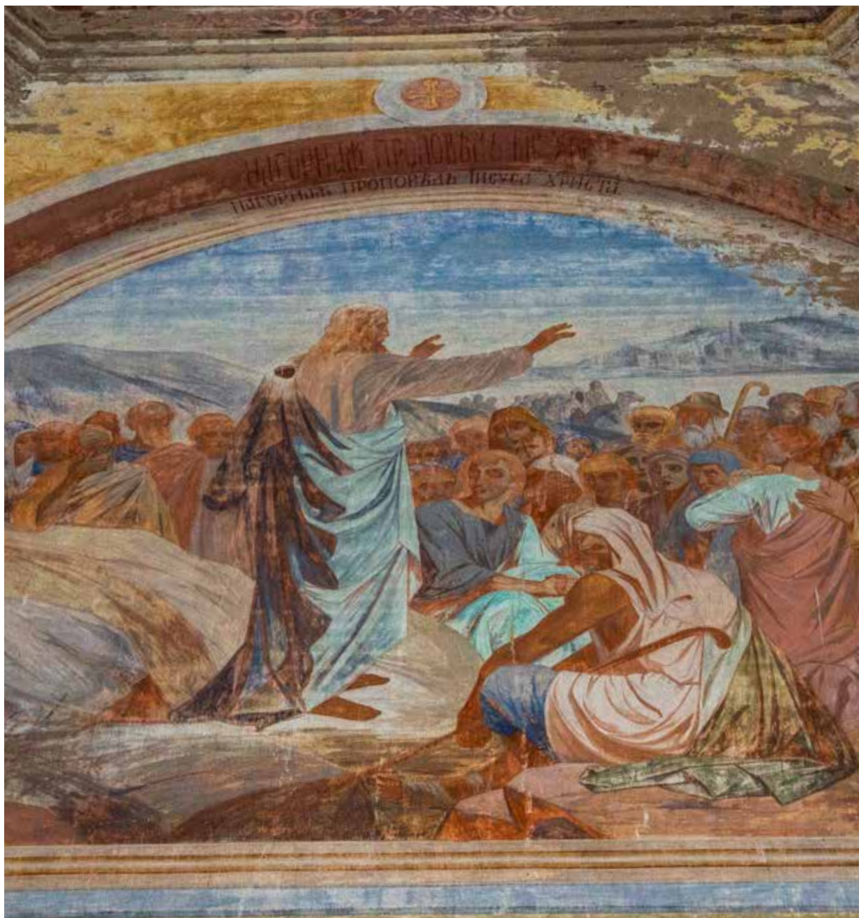
Нагорная Проповедь Иисуса Христа

If one looks closely, one can see that the faces of all the depicted people and saints are drawn poorly. The crowd at the Sermon on the Mount faces looking rather creepy. That might be because of either insufficient skill of the artist or the loss of the their top layers.