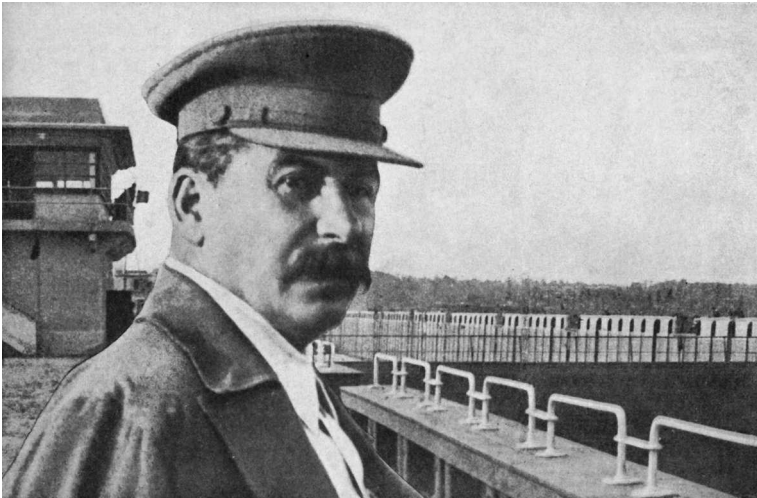
Иосиф Сталин на Перервинском шлюзе

Затем по вопросу о том, что темп развития сельского хозяйства у нас чрезмерно отстает от темпа развития ин-