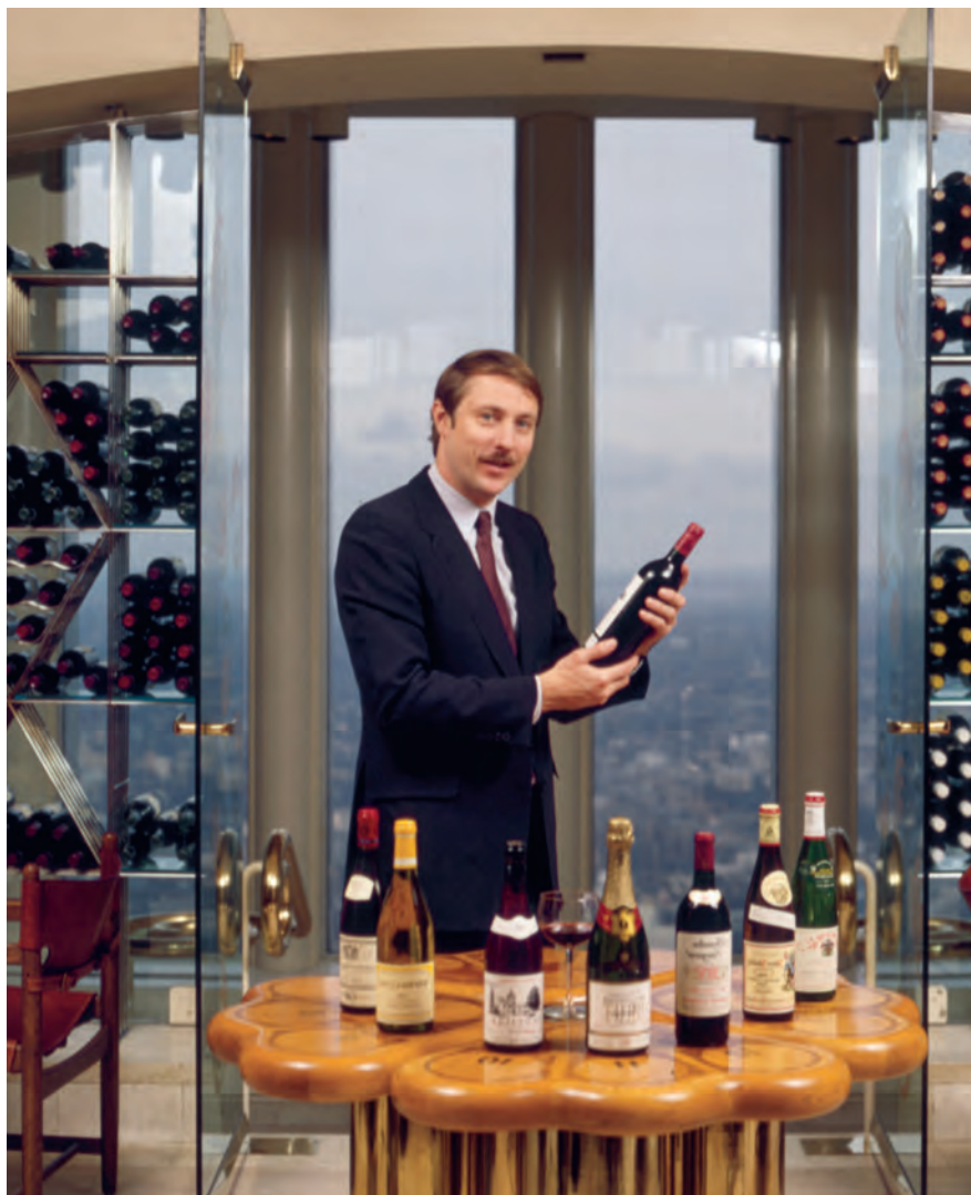
В заведении Cellar in the Sky

продолжала работать – непрерывно, с момента основания в 1976 году. Вначале это была маленькая группа из десяти членов ланч-клуба, которые затем пригласили своих друзей, а те – своих друзей. Вскоре количество друзей членов клуба превысило количество самих членов, и список продолжал расти. В 1980 году мы открыли школу для всех желающих, и с того момента в ней прошли обучение свыше 20 000 человек.