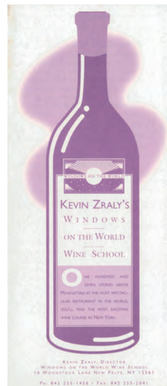
Одна из ранних брошюр Школы вина Windows on the World

Поскольку с 1993 по 1996 год ресторан был закрыт, я продолжал читать лекции в трех других локациях комплекса ВТЦ. Горжусь тем, что и в то сложное время Школа не прекращала работать. Это помогло