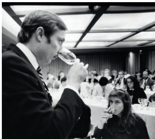
Обучение в Школе вина в начале 1980-х

для публики! Нам казалось, что ничего лучше уже не может быть, но мы ошибались. Лучшее было впереди.