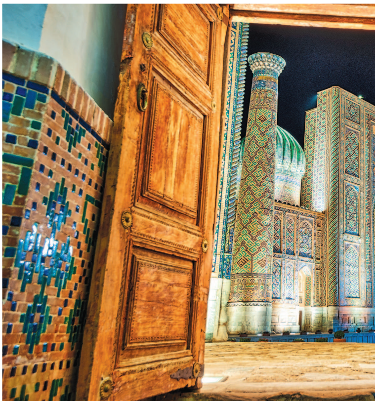
Площадь Регистан в центре Самарканда

Поддайтесь очарованию Востока — приезжайте в Узбекистан: с друзьями, с семьей, в романтическое путешествие, на уик-энд или на весь отпуск. Наш путеводитель поможет вам в этом путешествии.