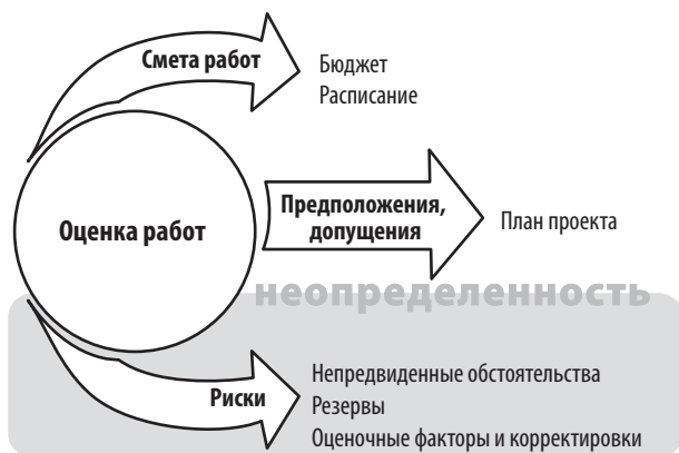
РИС. 7.3. Оценки — это ключевые входные данные для составления расписания, разработки бюджета и управления рисками

в основе всех оценок, как и основные факторы рисков, которые могут повлиять на точность оценок. Схематично это отражено на рис. 7.3.