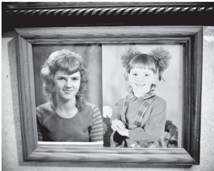
Фотографии мамы в юности и меня в детстве, у бабушки в квартире.