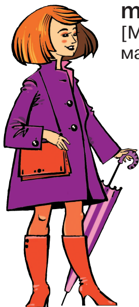
mother [МАЗЭ] мать