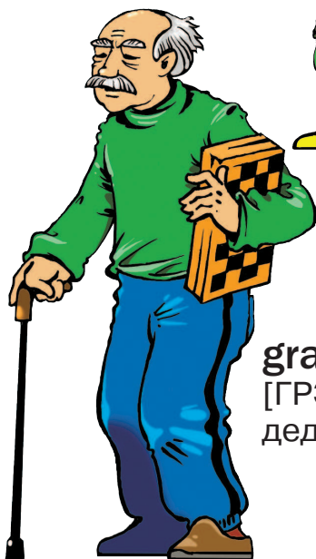
grandfather [ГРЭНФА:ЗЭ] дедушка