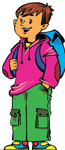
brother [БРАЗЭ] брат