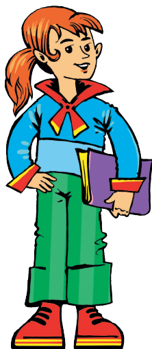
sister [СИСТЭ] сестра