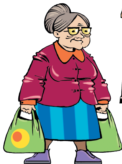
grandmother [ГРЭНМАЗЭ] бабушка