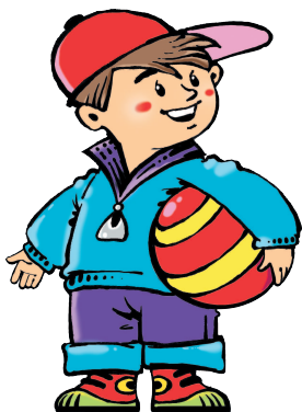
son [САН] сын