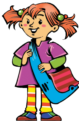
daughter [ДО:ТЭ] дочь