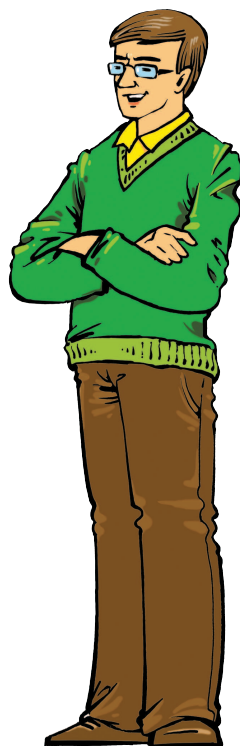
father [ФА:ЗЭ] отец