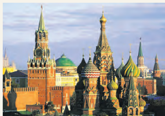
Москва — столица Российской Федерации