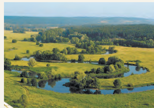
На Русской равнине