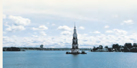
Волга в районе города Калезин