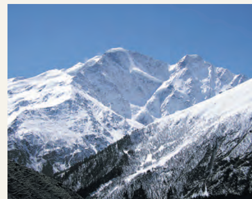
В горах Кавказа