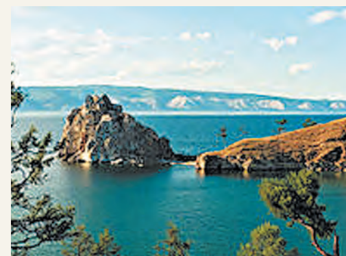
Байкал — природная жемчужина России

рии. В одном озере Байкал содержится около 19% мировых запасов пресной воды. Половина всех земель России занята лесами. Леса играют важную роль в газовом балансе атмосферы и регулировании планетарного климата Земли. В России находится пятая часть всех лесов мира и половина мировых хвойных лесов. Животный мир разнообразен. Количество видов животных на территории России достигает 125 тыс.