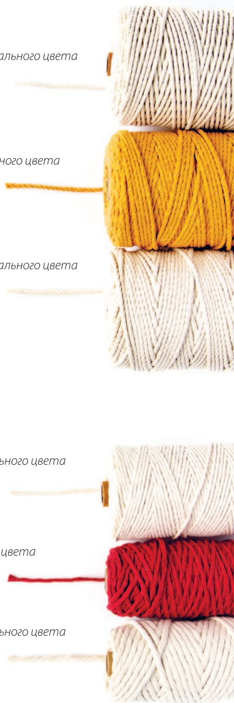
нить 7 мм натурального цвета