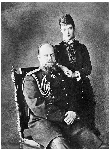
Император Александр III и императрица Мария Федоровна

Николай II — его история начинается со страшной даты, 1 мая 1881 года, когда группа молодых революционеров, принадлежащая террористической организации «Народная воля» бросила бомбу в царя Александра II.