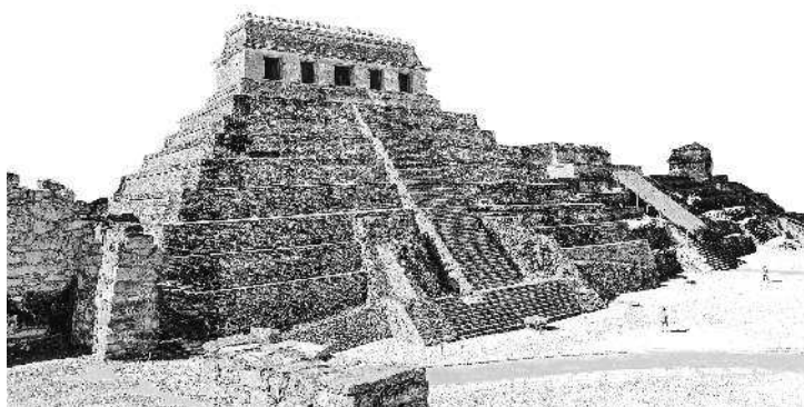
Гробница Пакаля, Паленке, Мексика

Сомнения в том, что в императорском саркофаге покоится кто-то другой, а не престарелый индеец, у исследователей возникли сразу. Мумия неожиданно оказалась двухметрового роста. Но откуда такой великан мог появиться в племени древних майя? Ведь все аборигены были низкорослыми, их рост не превышал 140—145 см. Но еще большее удивление вызвал сам саркофаг. Пятитонная плита, украшенная богатым орнаментом, повергла историков в шок. Потому что на рисунке ясно видно не что иное, как фигура пристегнутого к креслу вполне современного пилота