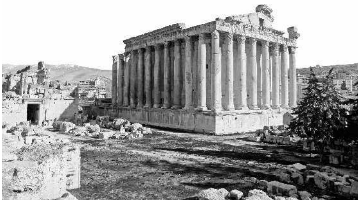
Храм Вакха (Меркурия) в Баальбеке, Ливан