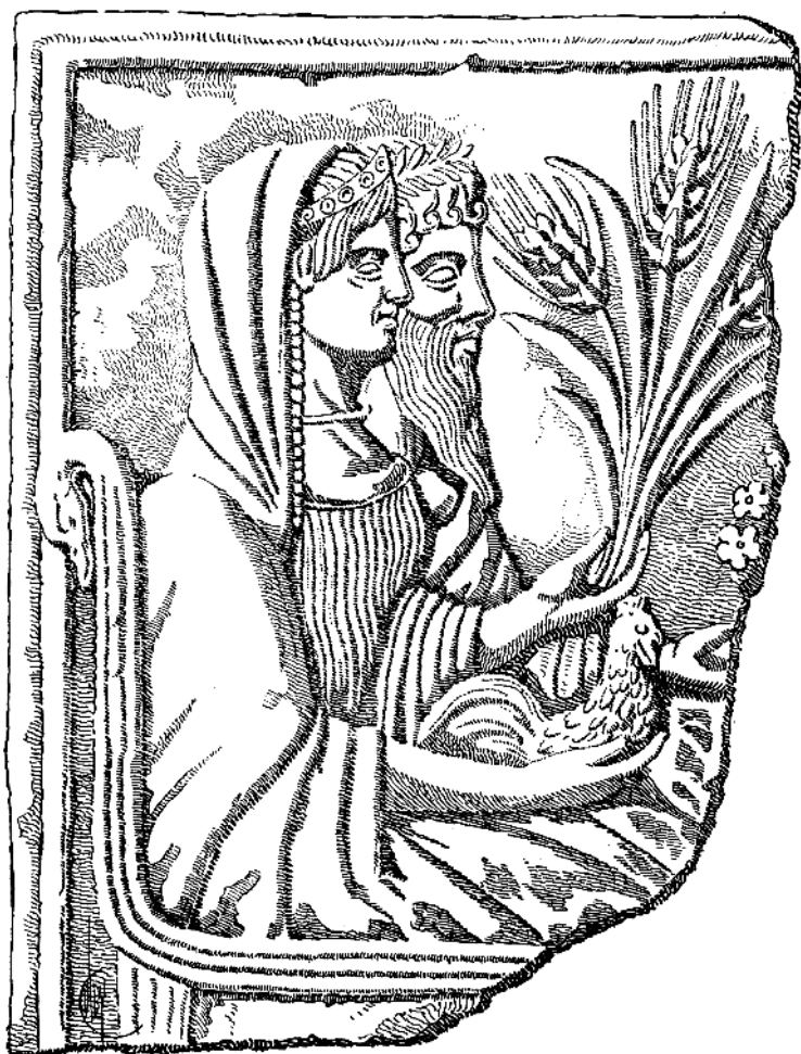
Царство Аида (Аид и Персефона)

рого движутся с грозным шипением змеи, сторожит выход. Суровый старый Харон, перевозчик душ умерших, не повезет через мрачные воды Ахеронта ни одну душу обратно, туда, где светит ярко солнце жизни.