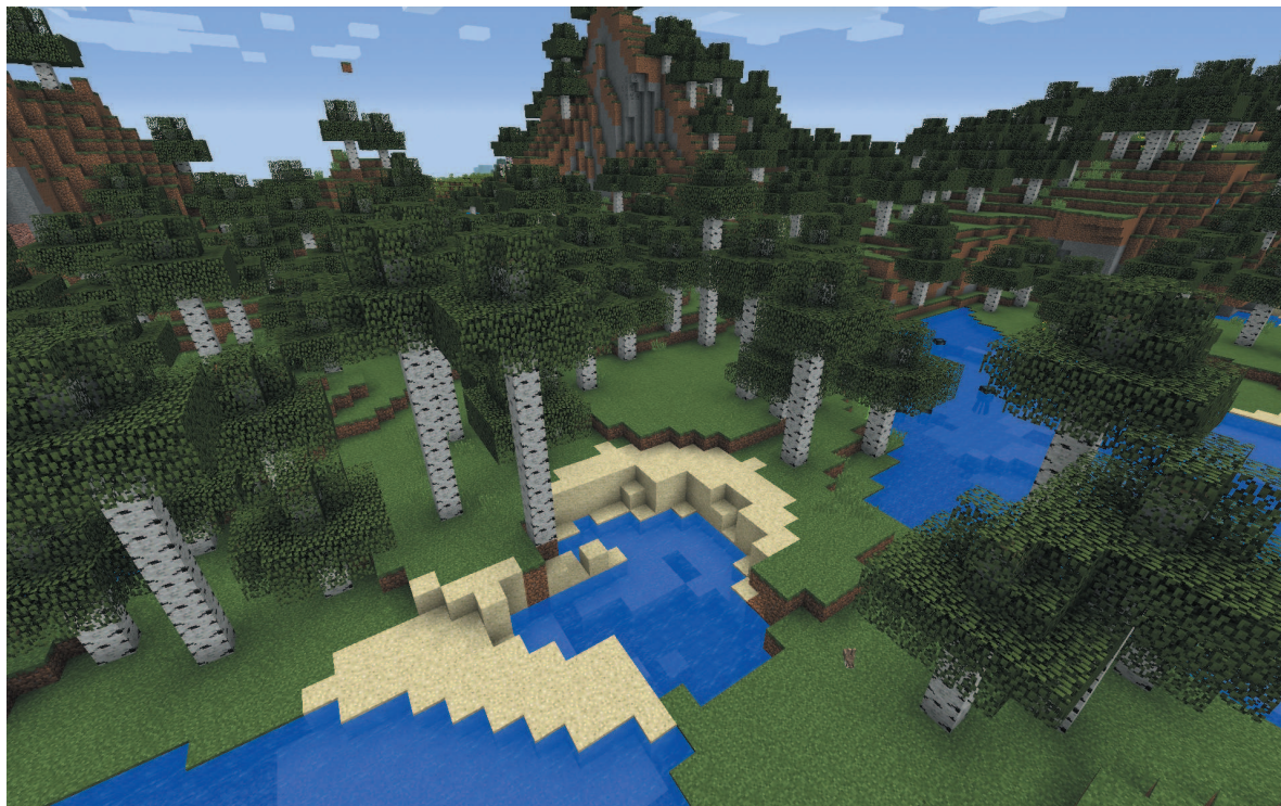
Самые высокие деревья растут в многолетнем березняке

Отличие березняка от обычного леса в том, что в нем растут только березы. Здесь, как и в лесном биоме, встречаются цветы, но их мало по сравнению с цветочным лесом. Нетрудно догадаться, что в холмистом березняке много холмов. А в многолетнем березняке растут более высокие деревья, чем в обычных лесных биомах.